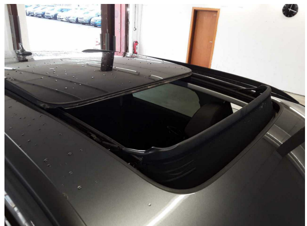
Abbildung 24: Sonstiges