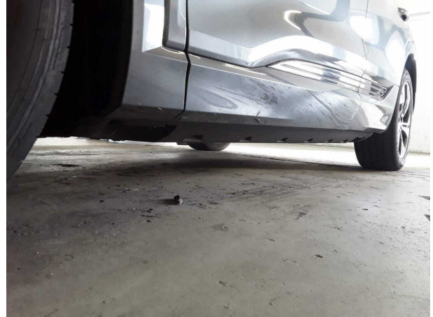
Abbildung 14: Sonstiges