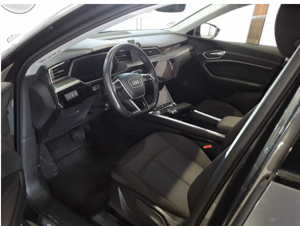
Abbildung 5: Innenraum