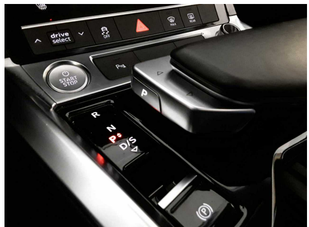
Abbildung 6: Innenraum