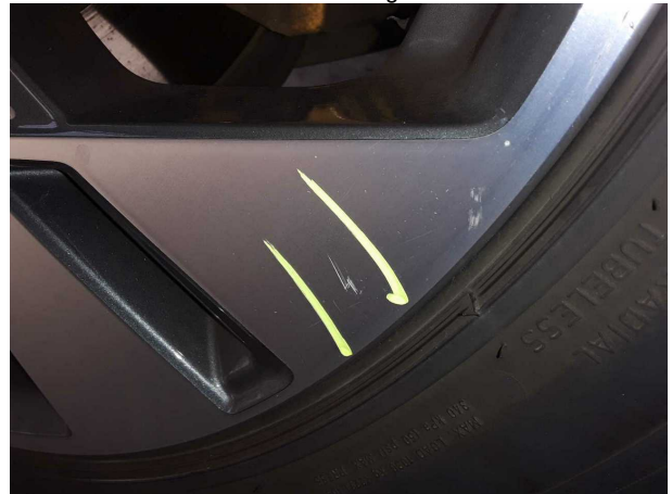
Beschädigung #2: Rad/Reifen: Leichtmetallfelge hinten rechts - verkratzt / verschürft - Wertminderung