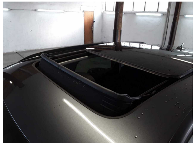
Abbildung 16: Sonstiges