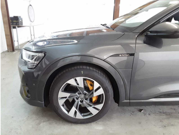
Abbildung 13: Sonstiges