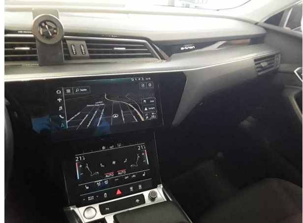
Abbildung 8: Innenraum