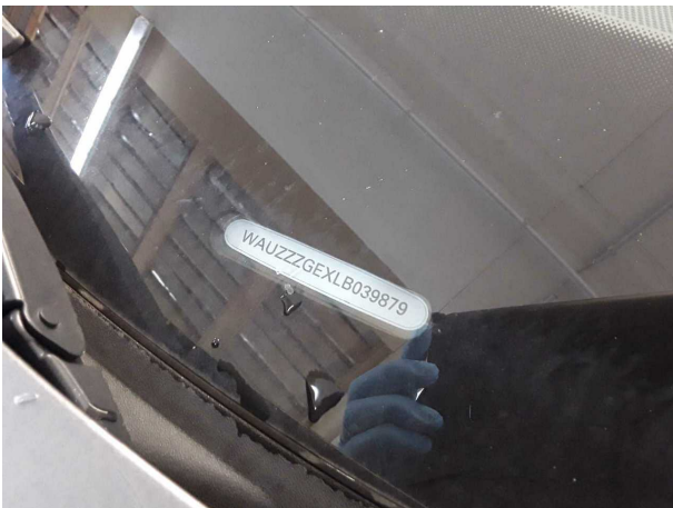
Abbildung 15: Sonstiges