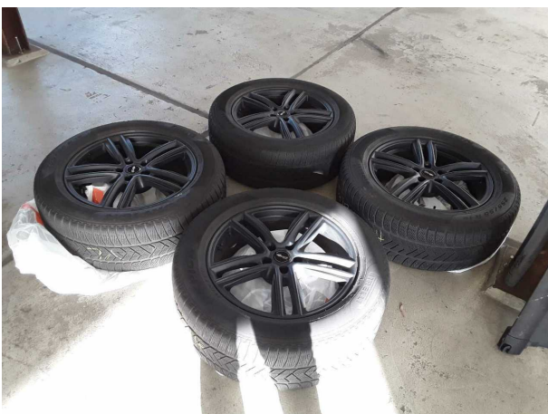
Abbildung 17: Sonstiges