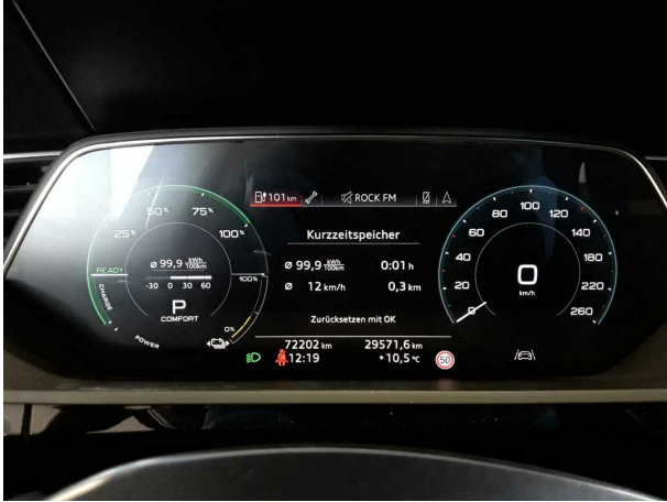
Abbildung 25: Sonstiges