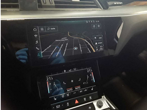
Abbildung 7: Innenraum