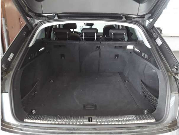
Abbildung 19: Sonstiges