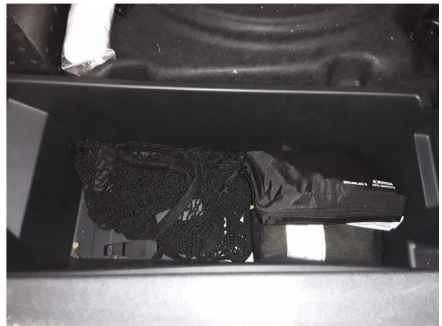
Abbildung 22: Sonstiges