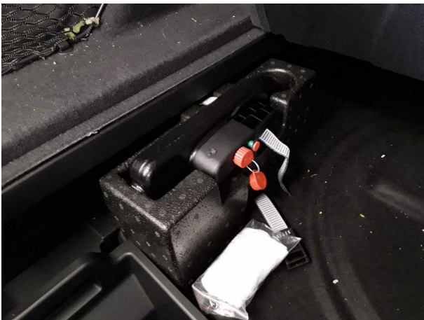
Abbildung 21: Sonstiges