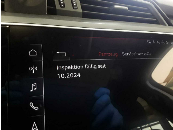
Beschädigung #4: Sonstiges: Inspektion/Wartung - fällig - erneuern