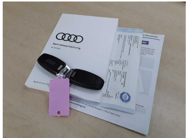
Abbildung 10: Sonstiges