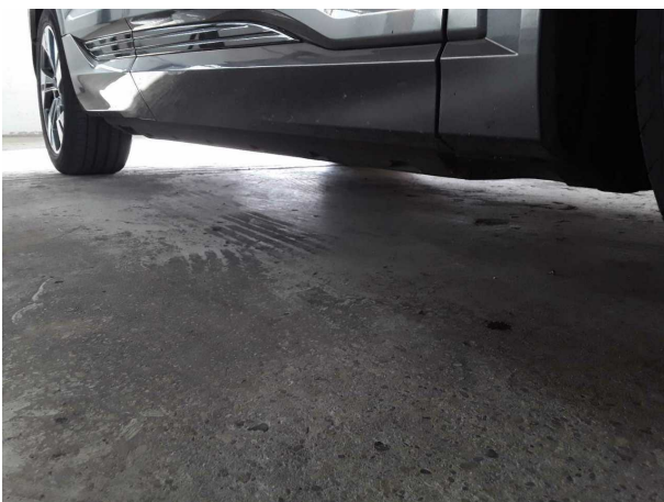
Abbildung 23: Sonstiges