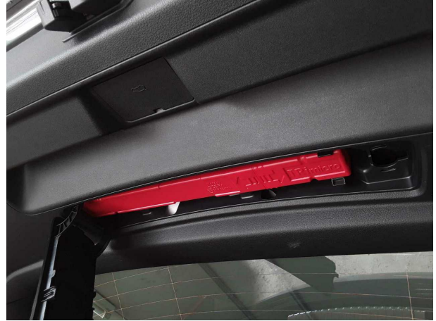
Abbildung 20: Sonstiges