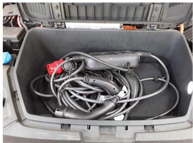
Abbildung 12: Sonstiges