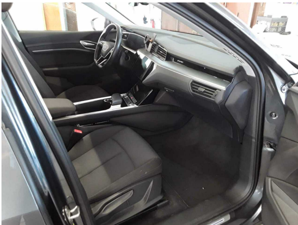
Abbildung 9: Innenraum