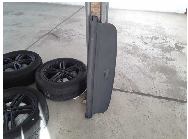
Abbildung 18: Sonstiges