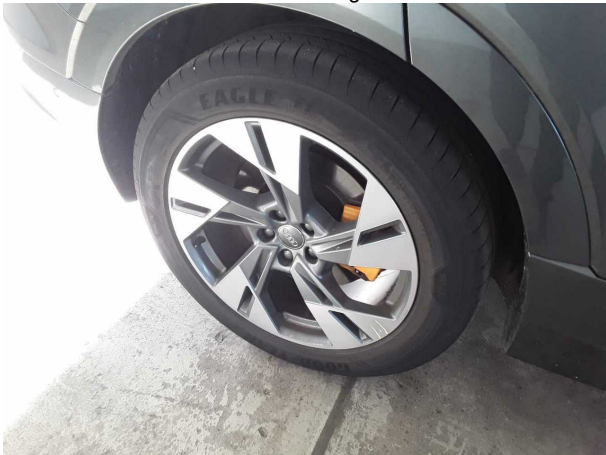
Beschädigung #2: Rad/Reifen: Leichtmetallfelge hinten rechts - verkratzt / verschürft - Wertminderung