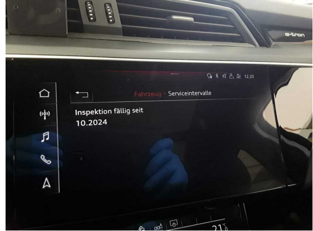
Abbildung 26: Sonstiges