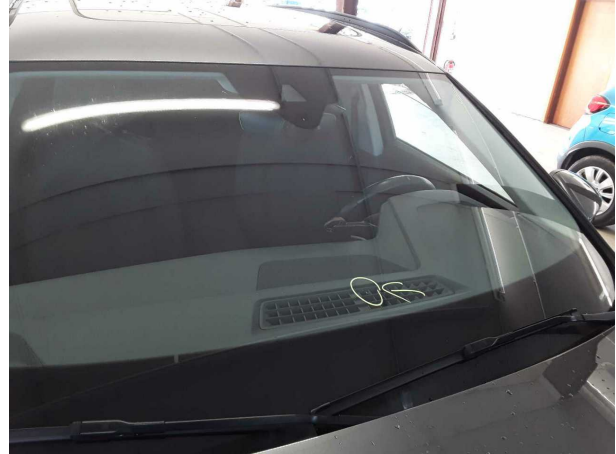
Dommege #5: Vitrage: Pare-brise (Rissbildung) - Dommege causé par des cailloux - Remplacer