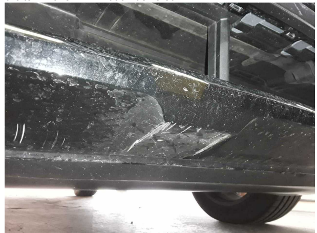
Dommage #3: Pare-chocs avant: Becquet - Erafé - Réparati... intelligente