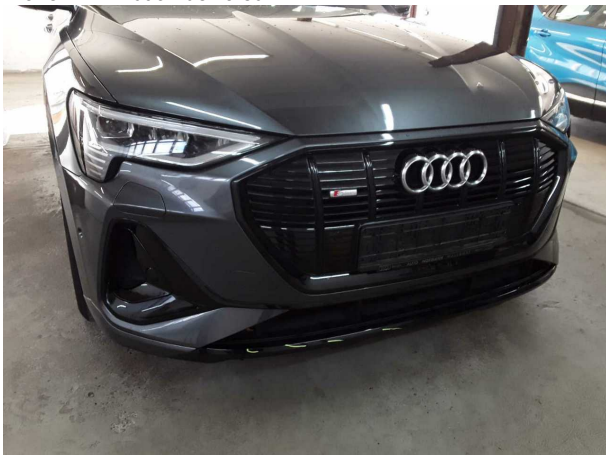
Dommage #3: Pare-chocs avant: Becquet - Erafé - Réparation intelligente