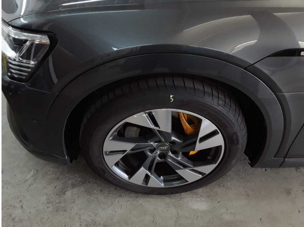
Dommage #1: Roue / Pneumatiques: Jante alliage avant gauche - Erafé - Diminution de valeur