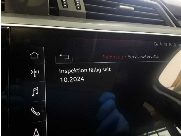
Dommege #4: Divers: Inspection / Maintenance - Exigible - Remplacer