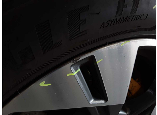
Dommage #1: Roue / Pneumatiques: Jante alliage avant gauche - Erafé - Diminution de valeur