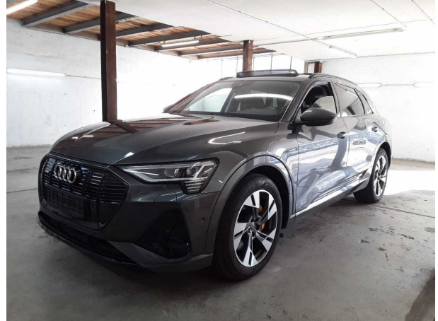
Illustration 2: Incliné à l'avant