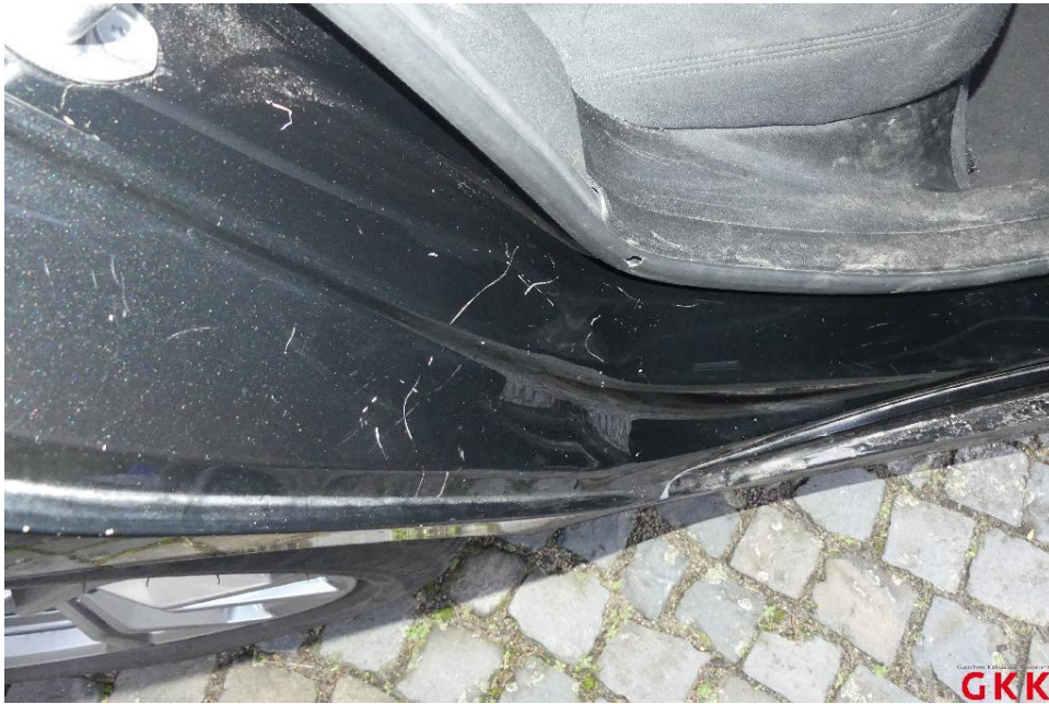
Bild 21. Tür hinten rechts, Einstieg, verkratzt, lackieren