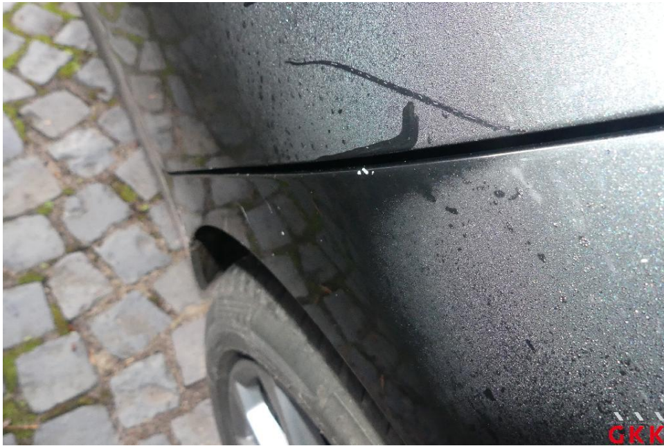
Bild 19. Seitenwand links, verkratzt, lackieren