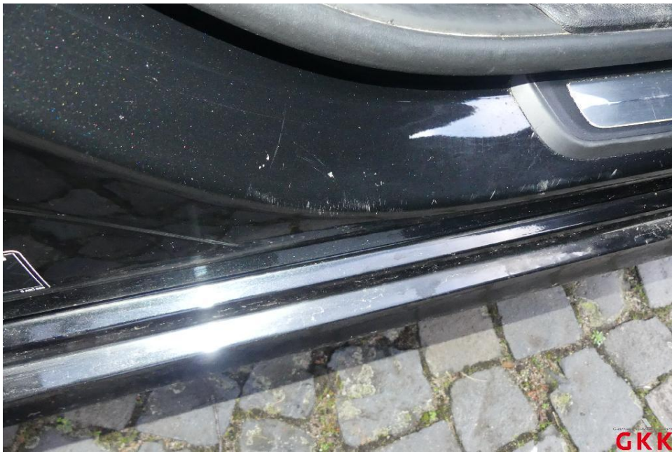
Bild 22. Tür hinten rechts, Einstieg, verkratzt, lackieren