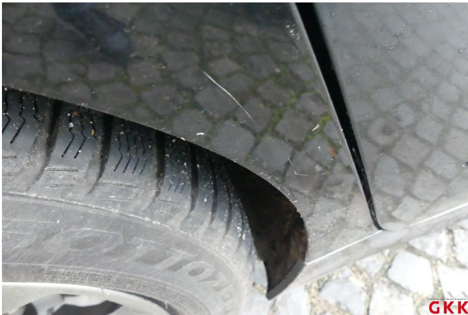
Bild 16. Seitenwand rechts, verkratzt, lackieren