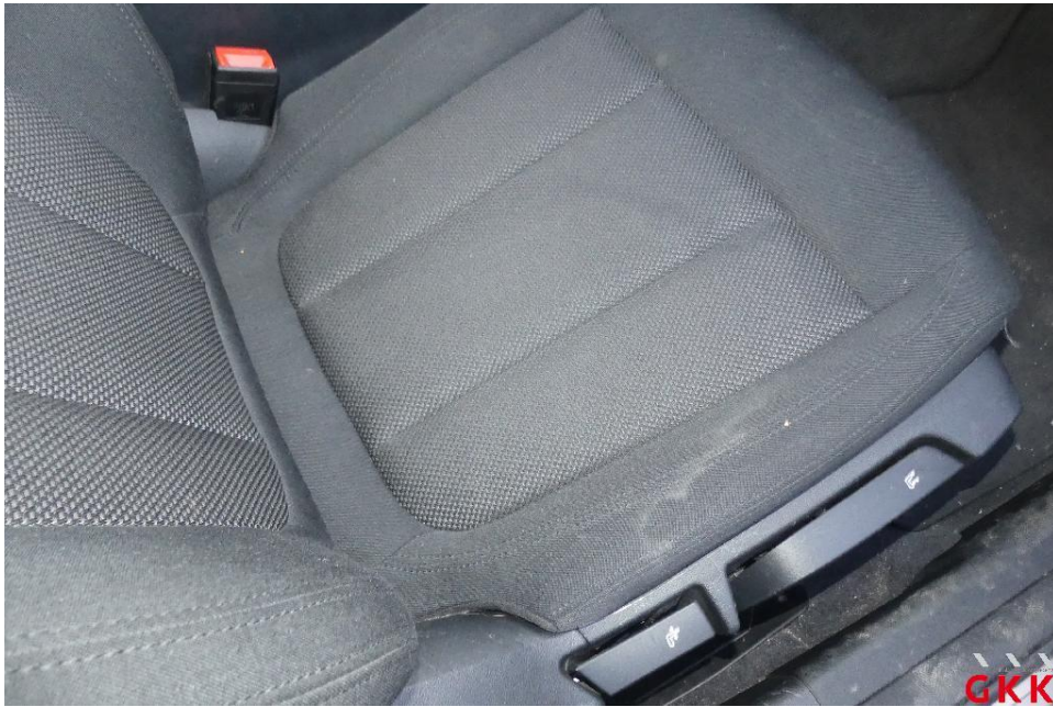
Bild 13. Sitz vorne rechts, Bezug Sitzkissen -Stoff-, verschmutzt, reinigen