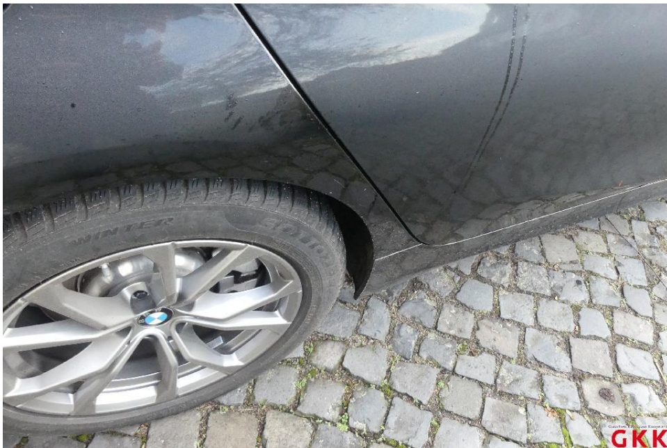
Bild 14. Seitenwand rechts, verkratzt, lackieren