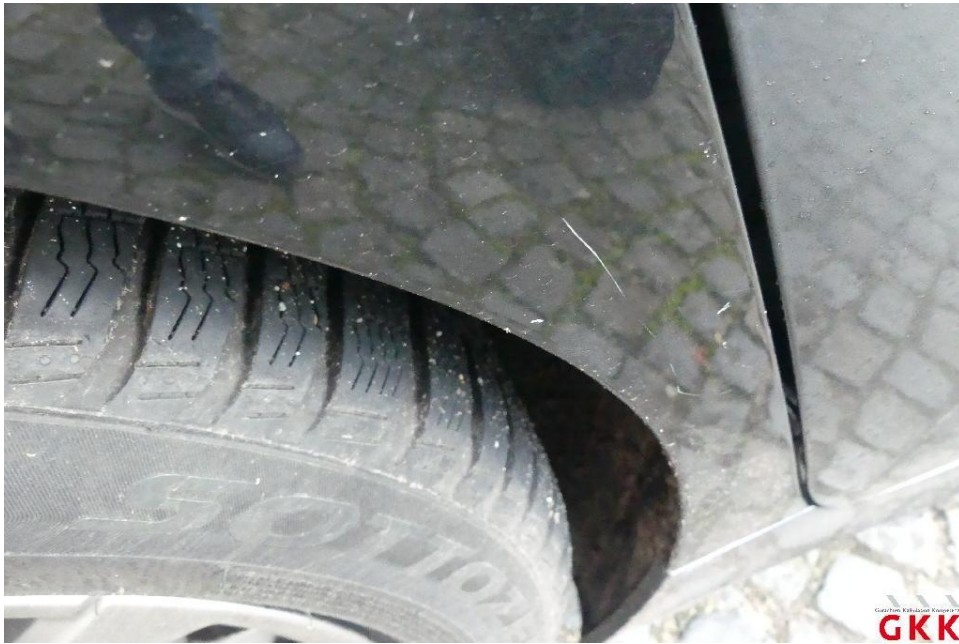
Bild 15. Seitenwand rechts, verkratzt, lackieren