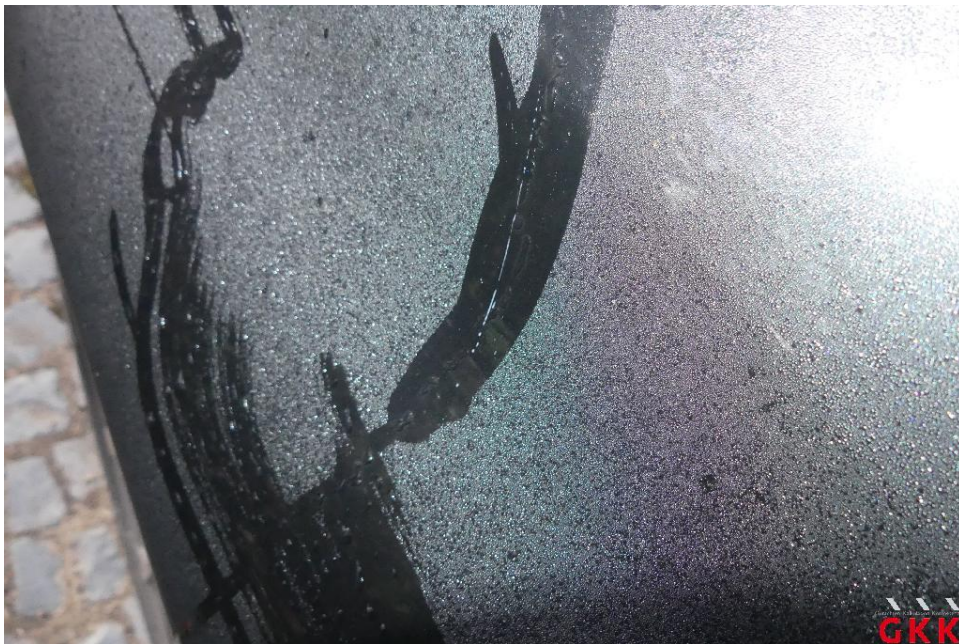
Bild 18. Seitenwand links, verkratzt, lackieren