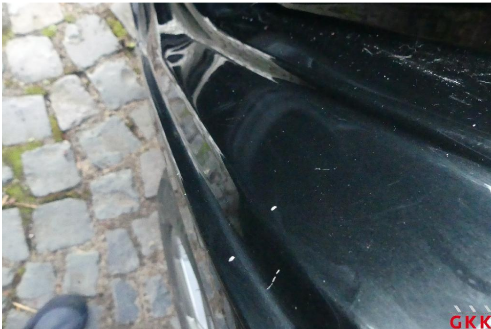
Bild 20. Tür hinten links, Einstieg, verkratzt, lackieren