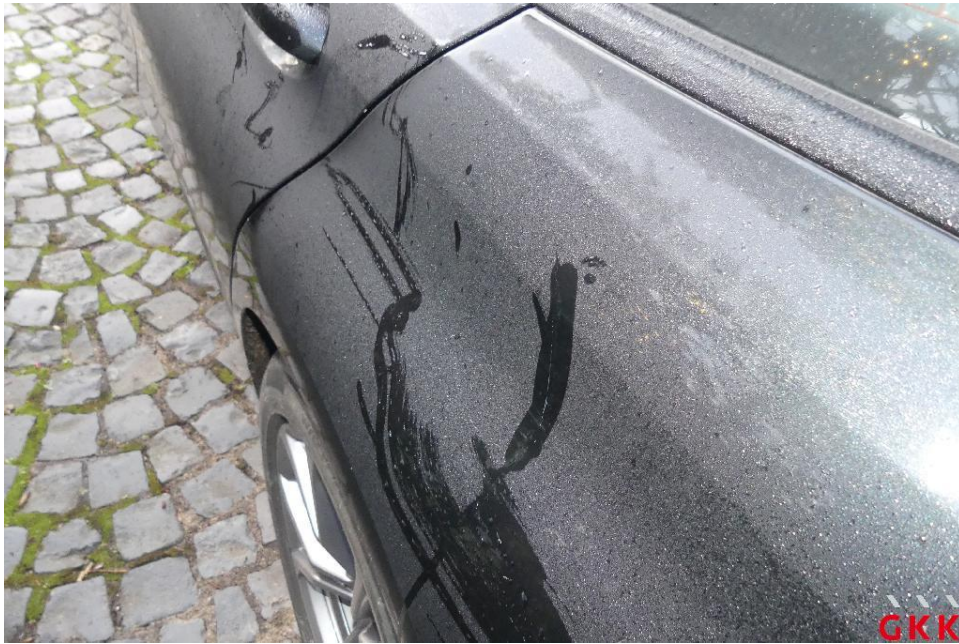
Bild 17. Seitenwand links, verkratzt, lackieren