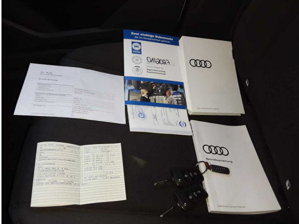
Abbildung 13: Dokumente