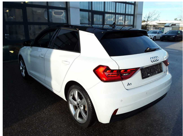
Abbildung 4: Schräg hinten