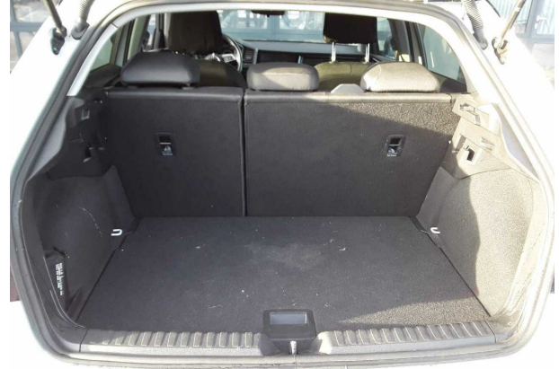
Abbildung 8: Laderaum