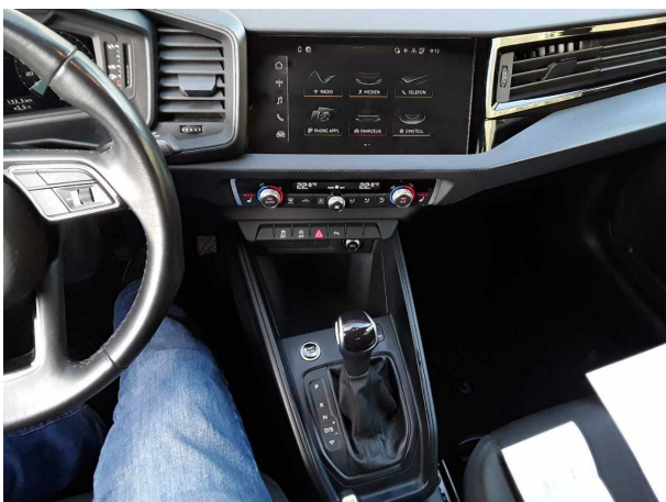
Abbildung 11: Instrumententafel