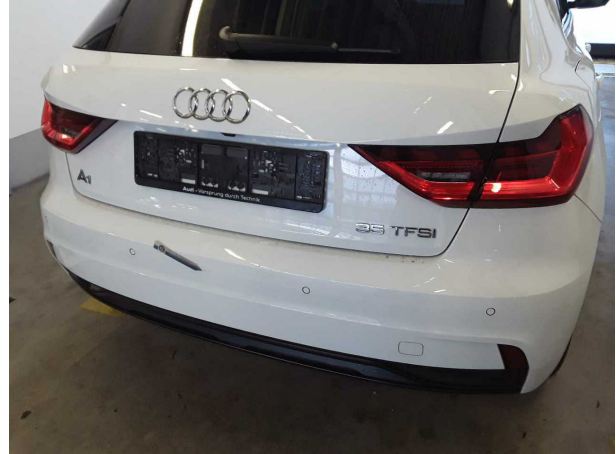
Beschädigung #4: Stossfänger hinten: Stossfänger hinten - verkratzt / verschürft - instandsetzen und lackieren