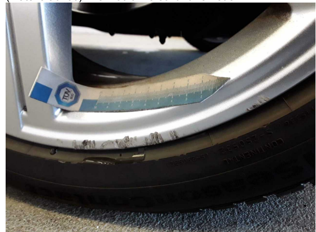
Beschädigung #3: Rad/Reifen: Leichtmetallfelge vorn rechts (Materialabrieb) - verkratzt / verschürft - erneuern