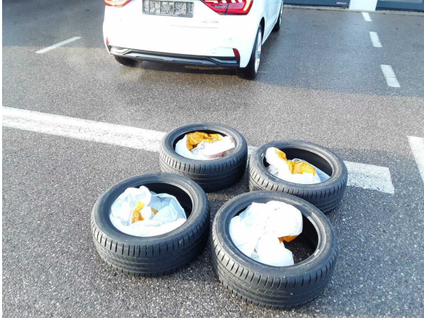
Beschädigung #1: 2.Radsatz: Reifensatz komplett (orig Sommerreifensatz montieren) - abweichend Auslieferungszustand -