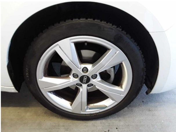
Beschädigung #3: Rad/Reifen: Leichtmetallfelge vorn rechts (Materialabrieb) - verkratzt / verschürft - erneuern