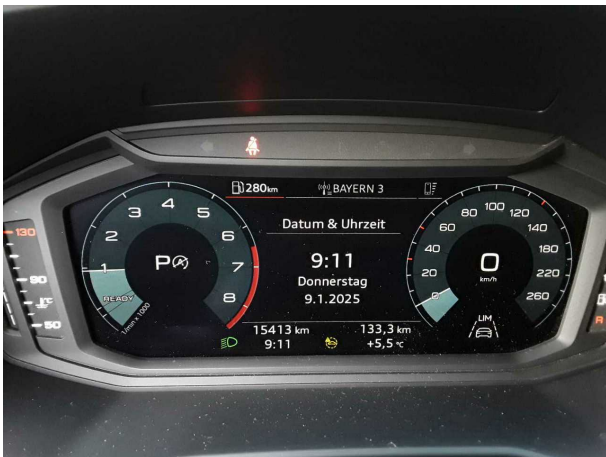
Abbildung 9: Kombiinstrument