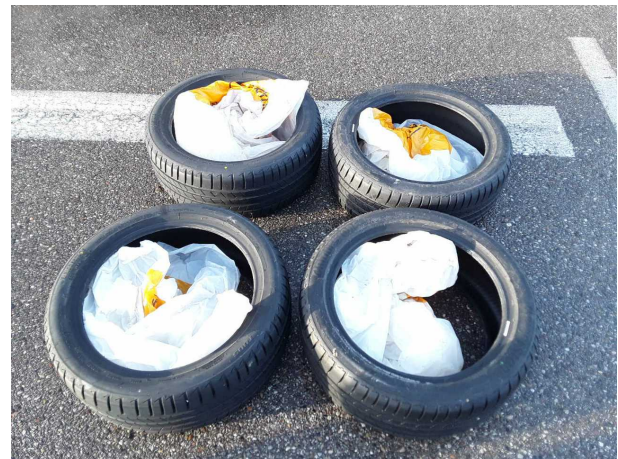
Abbildung 16: Zusatzbereifung