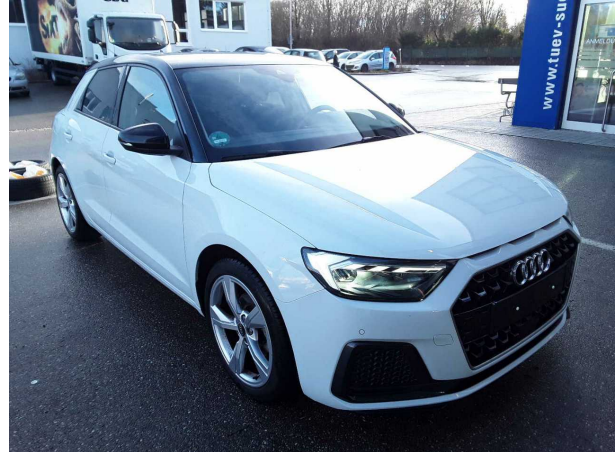
Abbildung 2: Schräg vorne