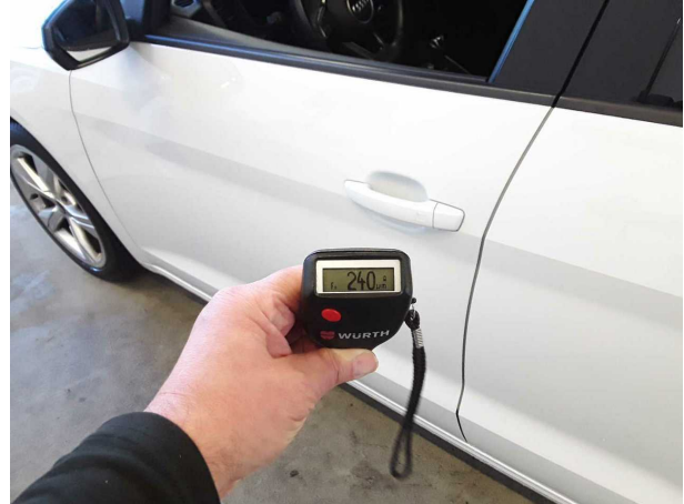
Nacklackierung 1: Kotflügel links, Tür vorne links