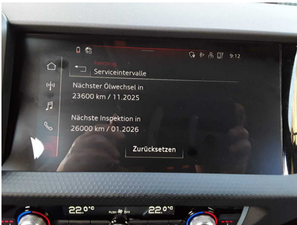
Abbildung 15: Sonstiges