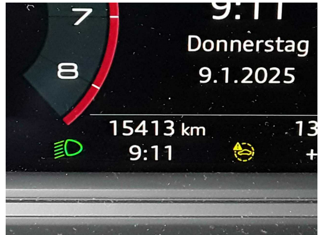
Abbildung 10: Kombiinstrument