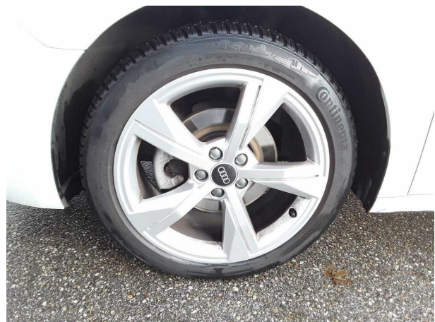
Abbildung 6: Montierte Bereifung