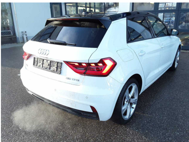
Abbildung 5: Schräg hinten