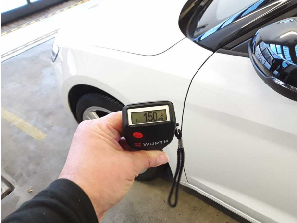
Nacklackierung 1: Kotflügel links, Tür vorne links