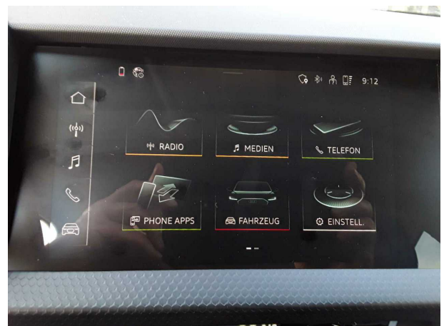
Abbildung 12: Instrumententafel