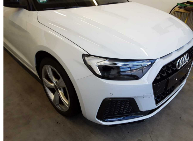
Beschädigung #3: Rad/Reifen: Leichtmetallfelge vorn rechts (Materialabrieb) - verkratzt / verschürft - erneuern