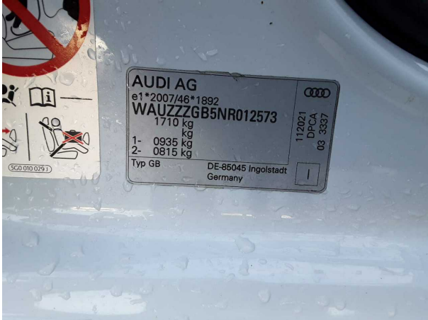
Abbildung 1: FIN