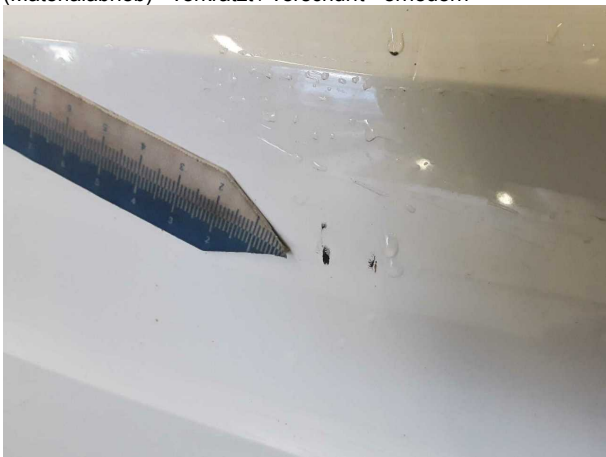
Beschädigung #4: Stossfänger hinten: Stossfänger hinten - verkratzt / verschürft - instandsetzen und lackieren