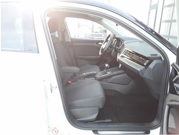
Abbildung 7: Innenraum vorne