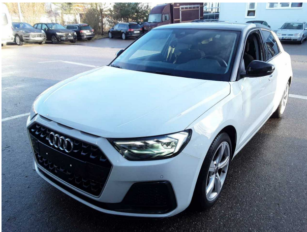
Abbildung 3: Schräg vorne