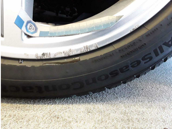
Beschädigung #3: Rad/Reifen: Leichtmetallfelge vorn rechts (Materialabrieb) - verkratzt / verschürft - erneuern