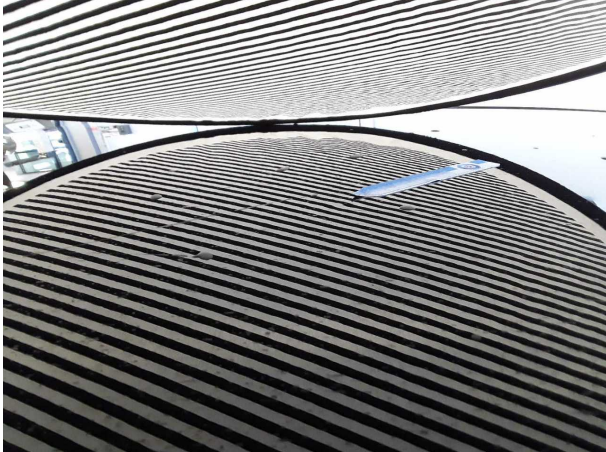
Beschädigung #2: Fahrzeugdach: Dach - Delle(n) - Smart Repair