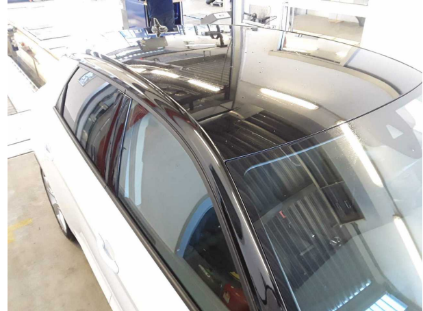
Beschädigung #2: Fahrzeugdach: Dach - Delle(n) - Smart Repair