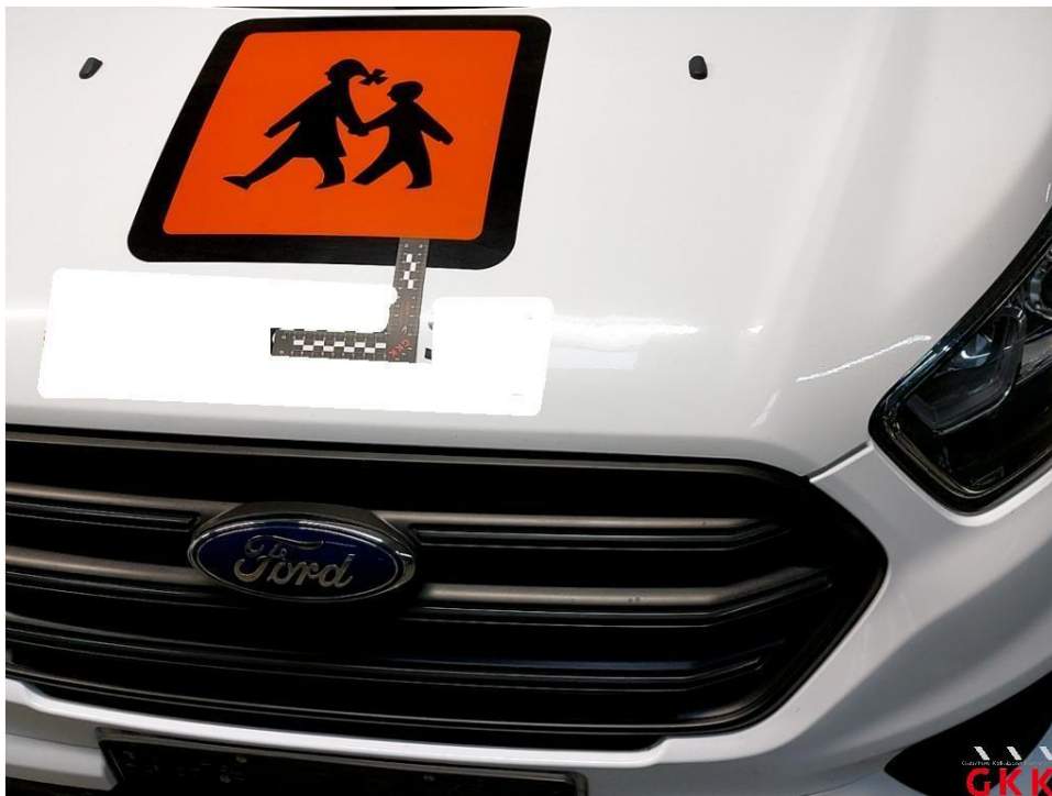
Bild 16 Motorhaube, beschädigt, instand setzen - lackieren