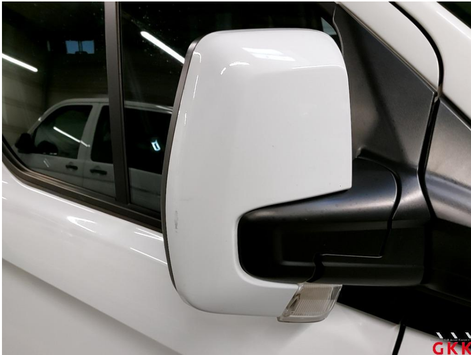
Bild 21 Spiegelgehäuse rechts, Blende -lackiert-, verkratzt, lackieren ohne LV