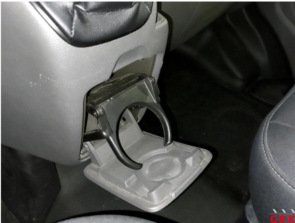
Bild 18 Getränkehalter, Mitte, beschädigt, ersetzen