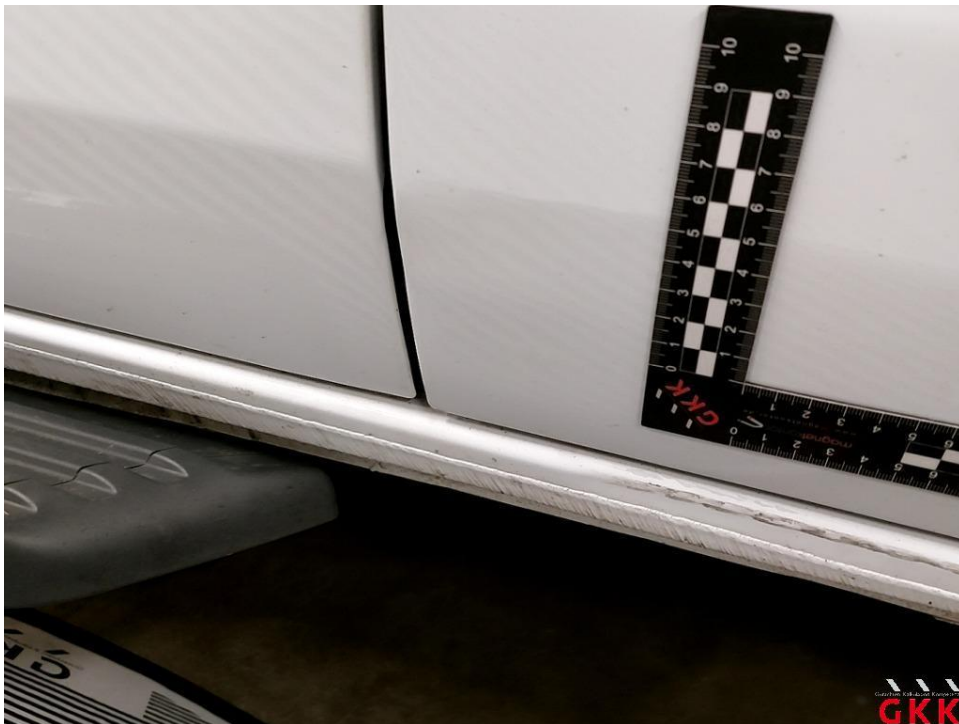
Bild 26 Tür vorne rechts, beschädigt, instand setzen - lackieren