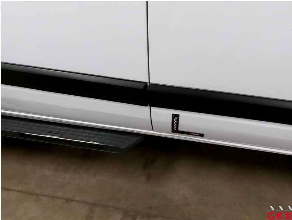
Bild 25 Tür vorne rechts, beschädigt, instand setzen - lackieren