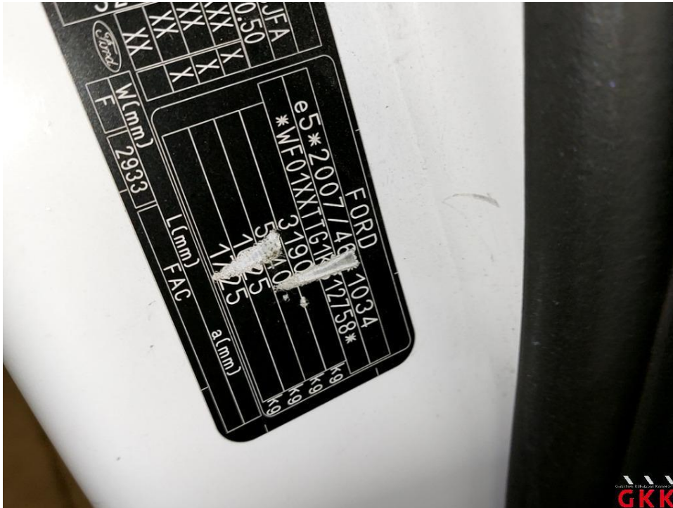
Bild 15 Tür vorne rechts, Einstieg, beschädigt, Smartrepair