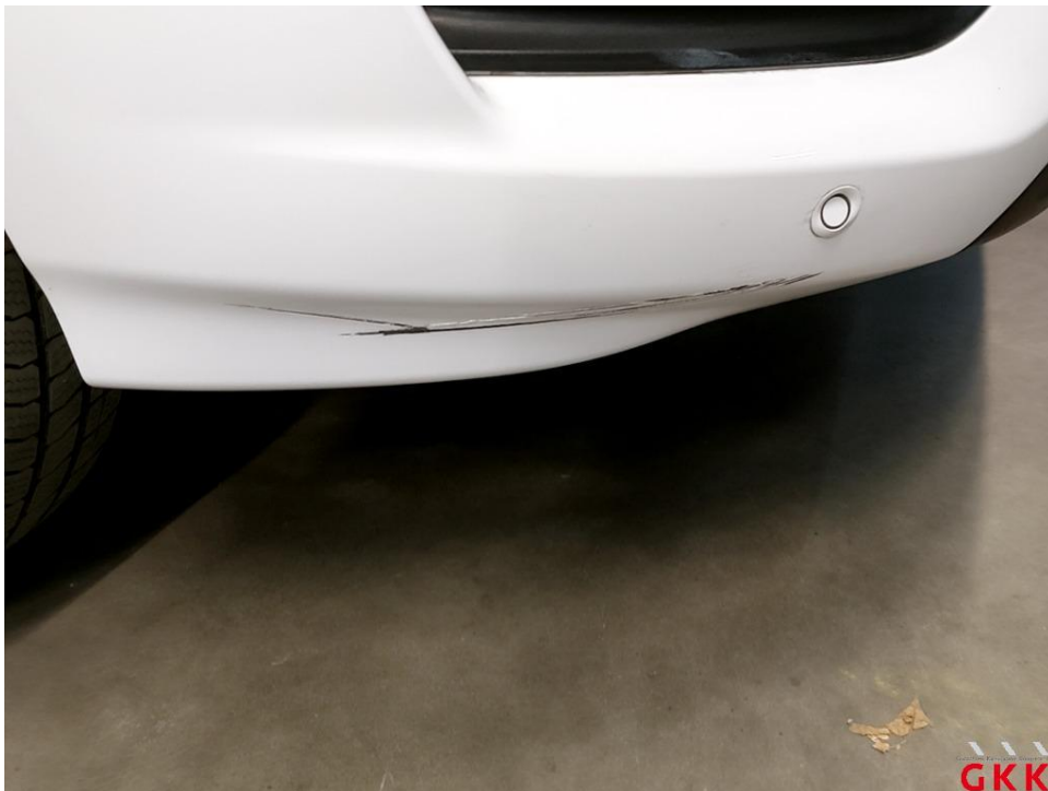
Bild 20 Stoßfänger vorne, Spoiler -lackiert-, verkratzt, lackieren