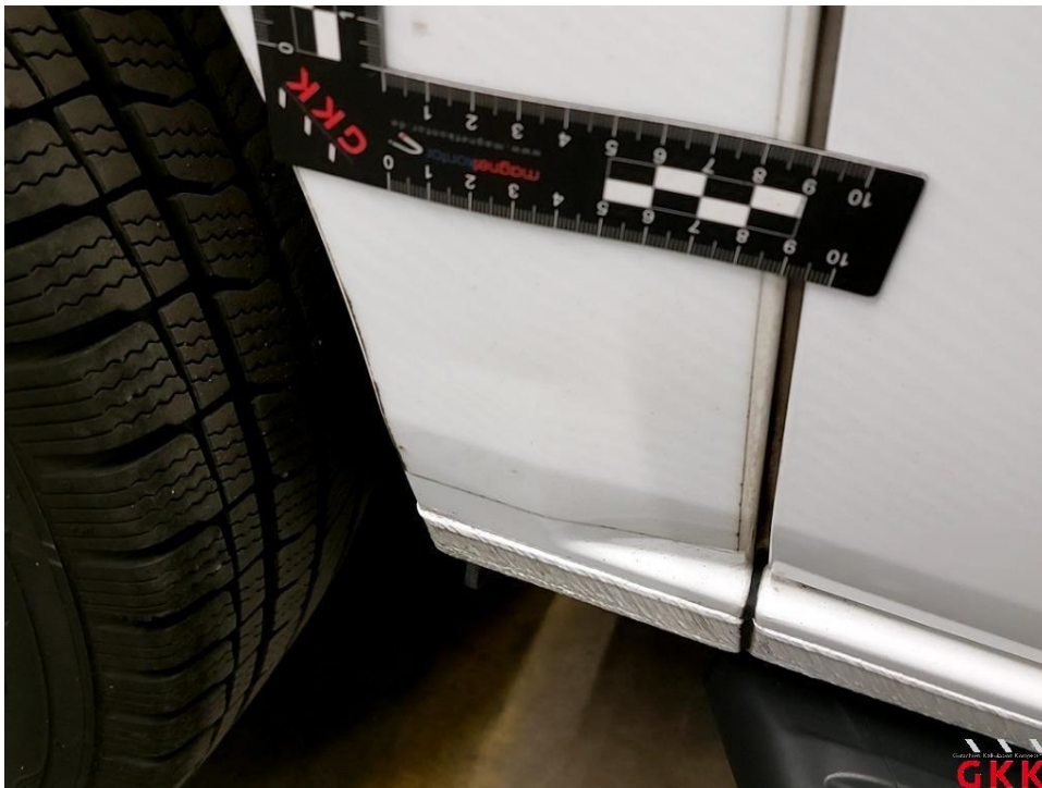
Bild 28 Seitenwand rechts, Reparaturmangel, instand setzen - lackieren