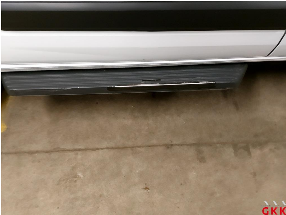
Bild 23 Trittbrett rechts verkratzt, lackieren