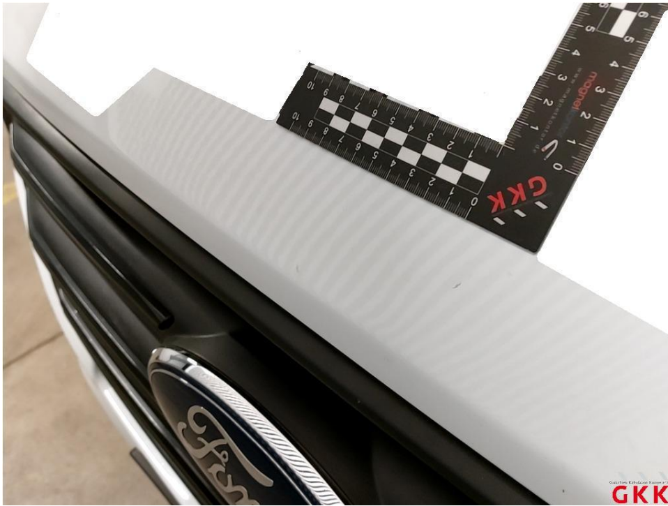
Bild 17 Motorhaube, beschädigt, instand setzen - lackieren