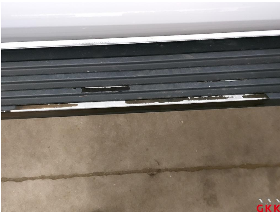
Bild 24 Trittbrett rechts verkratzt, lackieren