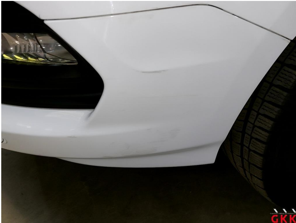
Bild 19 Stoßfänger vorne, Spoiler -lackiert-, verkratzt, lackieren