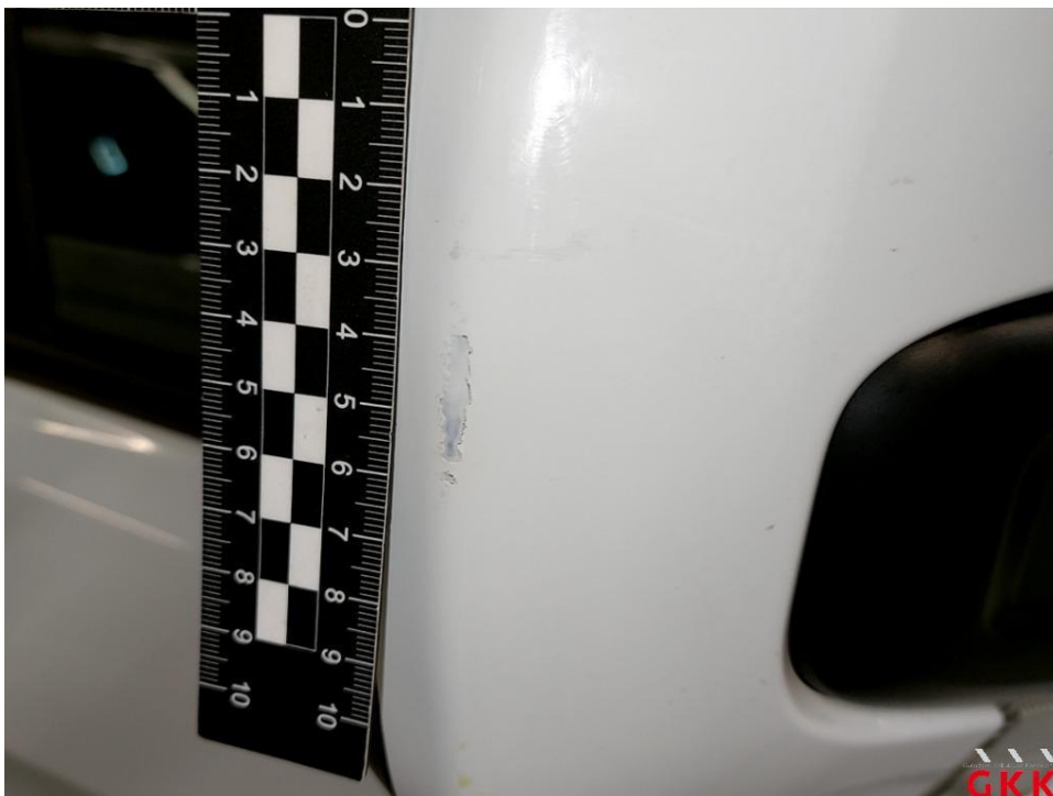
Bild 22 Spiegelgehäuse rechts, Blende -lackiert-, verkratzt, lackieren ohne LV