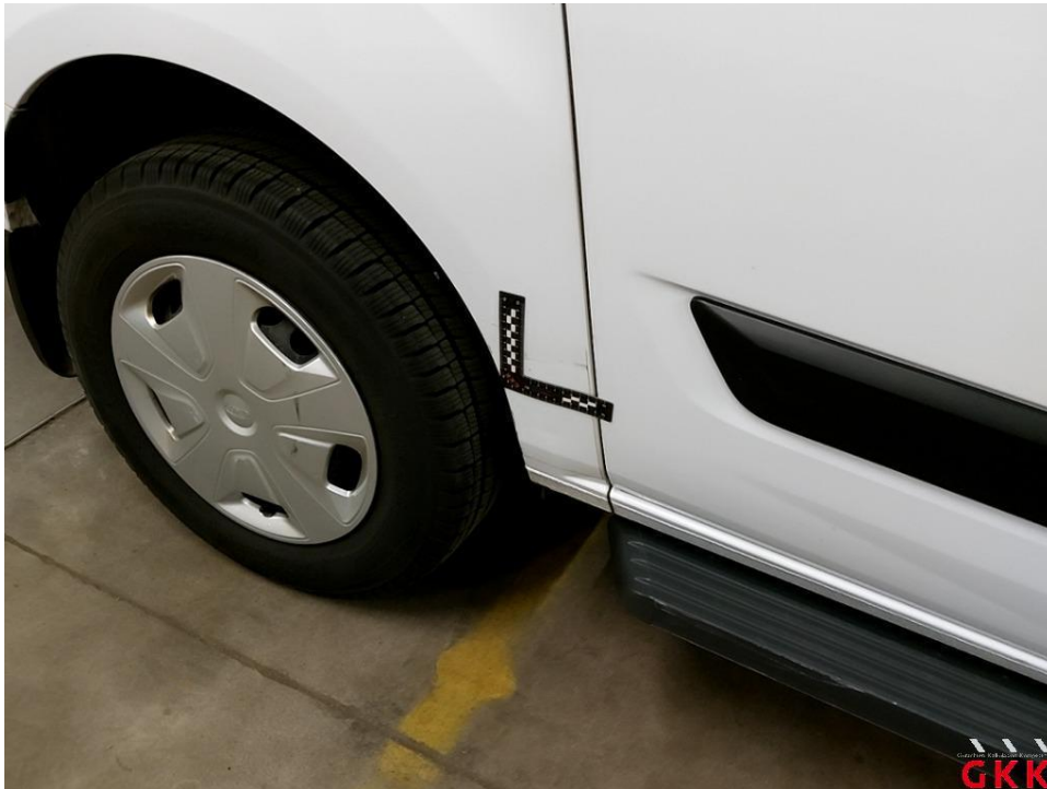
Bild 27 Seitenwand rechts, Reparaturmangel, instand setzen - lackieren