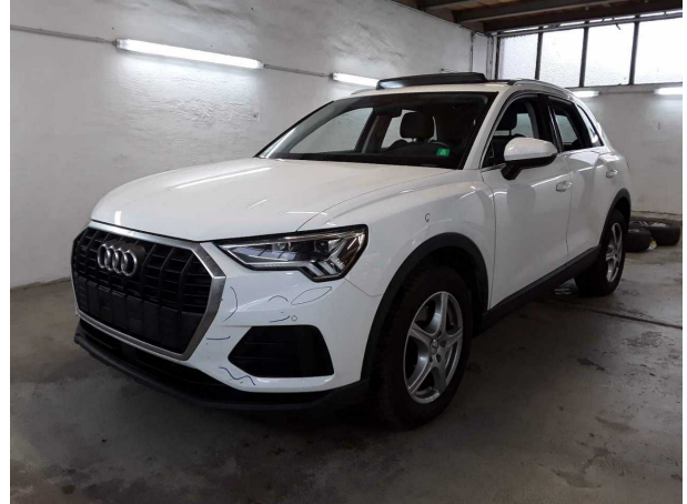
Illustration 2: Incliné à l'avant