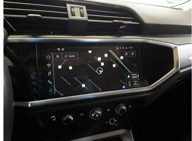
Abbildung 8: Innenraum