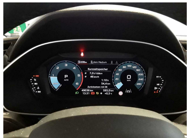
Abbildung 12: Sonstiges