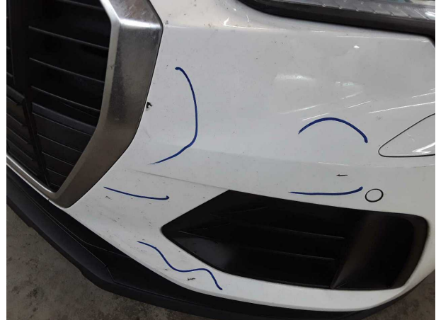
Beschädigung #2: Stossfänger vorn: Stossfänger vorn - verkratzt / verschürft - instandsetzen und lackieren