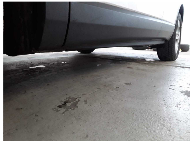
Abbildung 16: Sonstiges