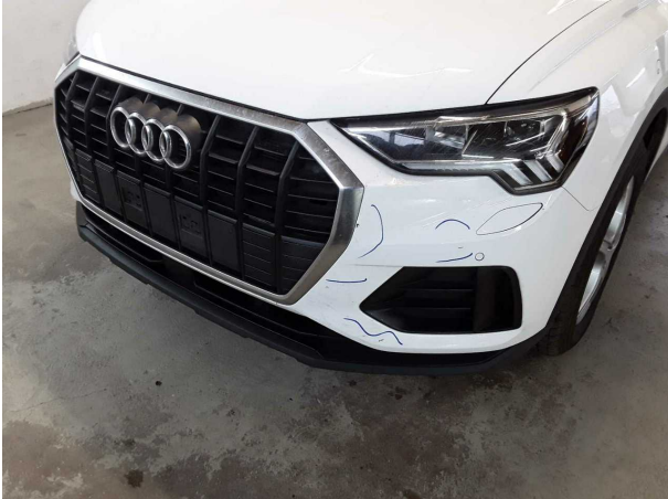
Beschädigung #2: Stossfänger vorn: Stossfänger vorn - verkratzt / verschürft - instandsetzen und lackieren