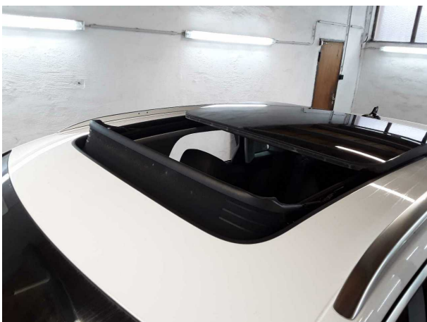
Abbildung 11: Sonstiges