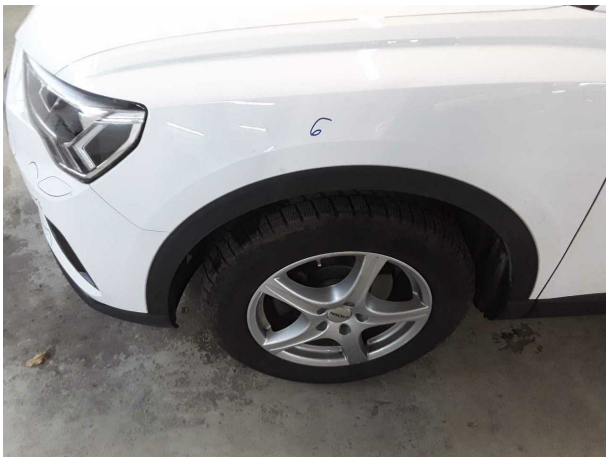
Abbildung 15: Sonstiges