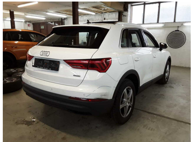
Abbildung 4: Schräg hinten