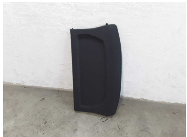
Abbildung 18: Sonstiges