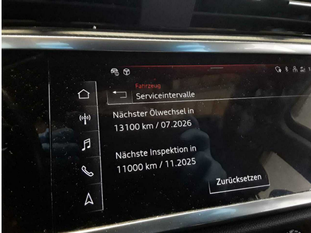
Abbildung 13: Sonstiges