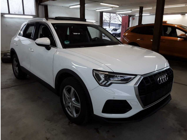
Abbildung 1: Schräg vorne