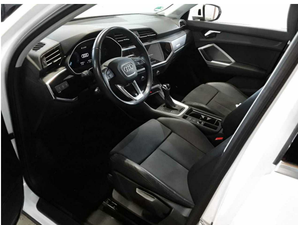
Abbildung 5: Innenraum