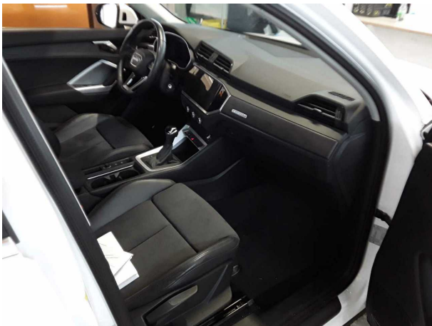
Abbildung 9: Innenraum