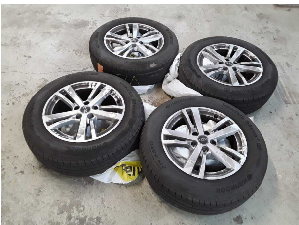
Abbildung 17: Sonstiges