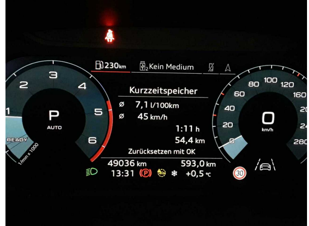
Abbildung 14: Sonstiges