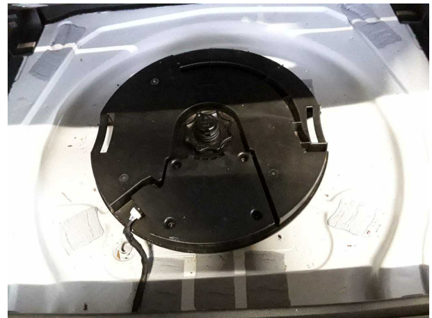
Abbildung 22: Sonstiges