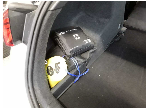
Abbildung 20: Sonstiges