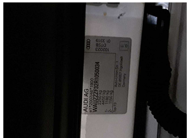
Abbildung 24: Sonstiges