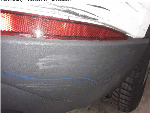
Beschädigung #3: Stossfänger hinten: Stossfänger hinten (Stark verkratzt) - verformt - erneuern