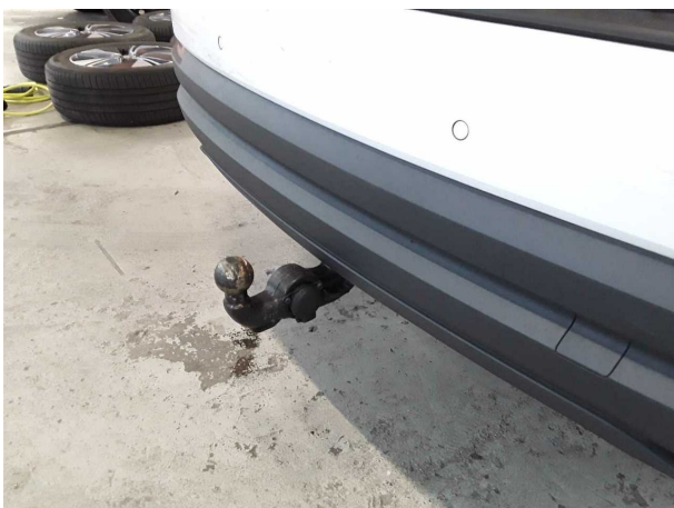
Abbildung 23: Sonstiges