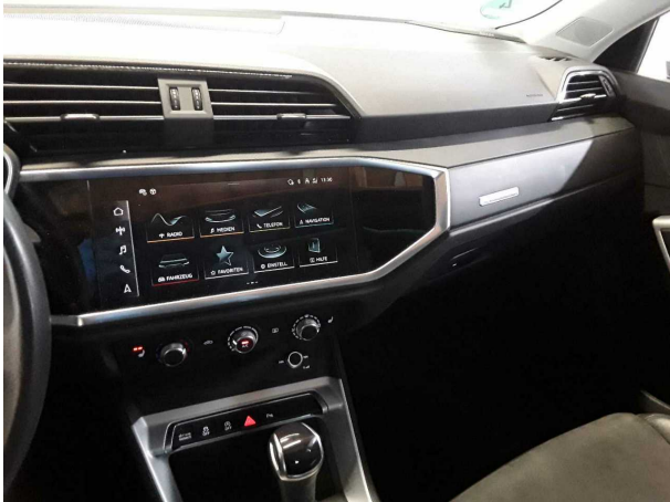
Abbildung 7: Innenraum