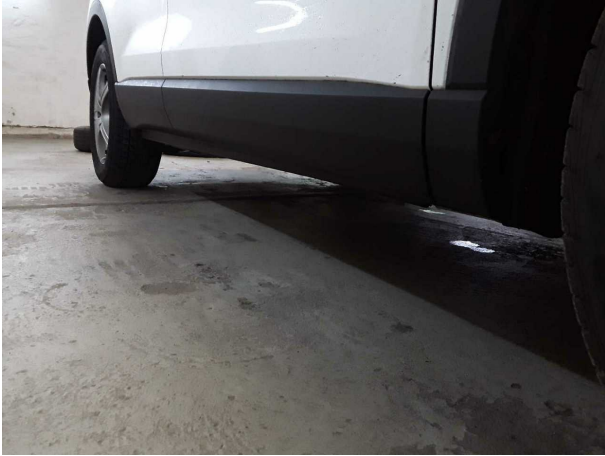
Abbildung 25: Sonstiges