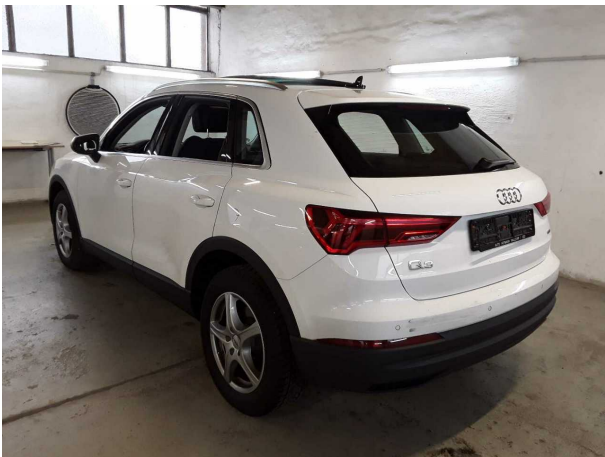
Abbildung 3: Schräg hinten