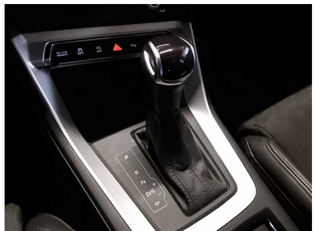
Abbildung 6: Innenraum