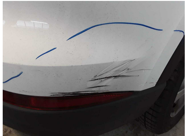
Beschädigung #3: Stossfänger hinten: Stossfänger hinten (Stark verkratzt) - verformt - erneuern