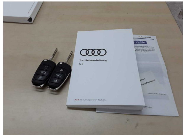
Abbildung 10: Sonstiges