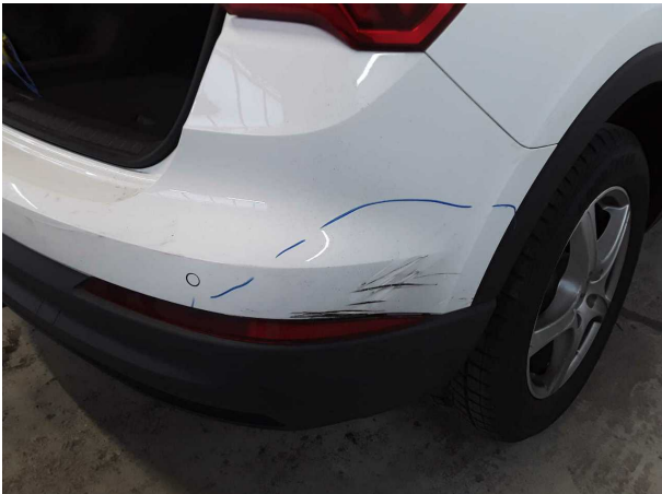
Beschädigung #3: Stossfänger hinten: Stossfänger hinten (Stark verkratzt) - verformt - erneuern