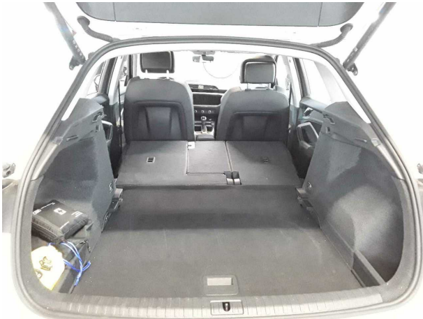
Abbildung 19: Sonstiges