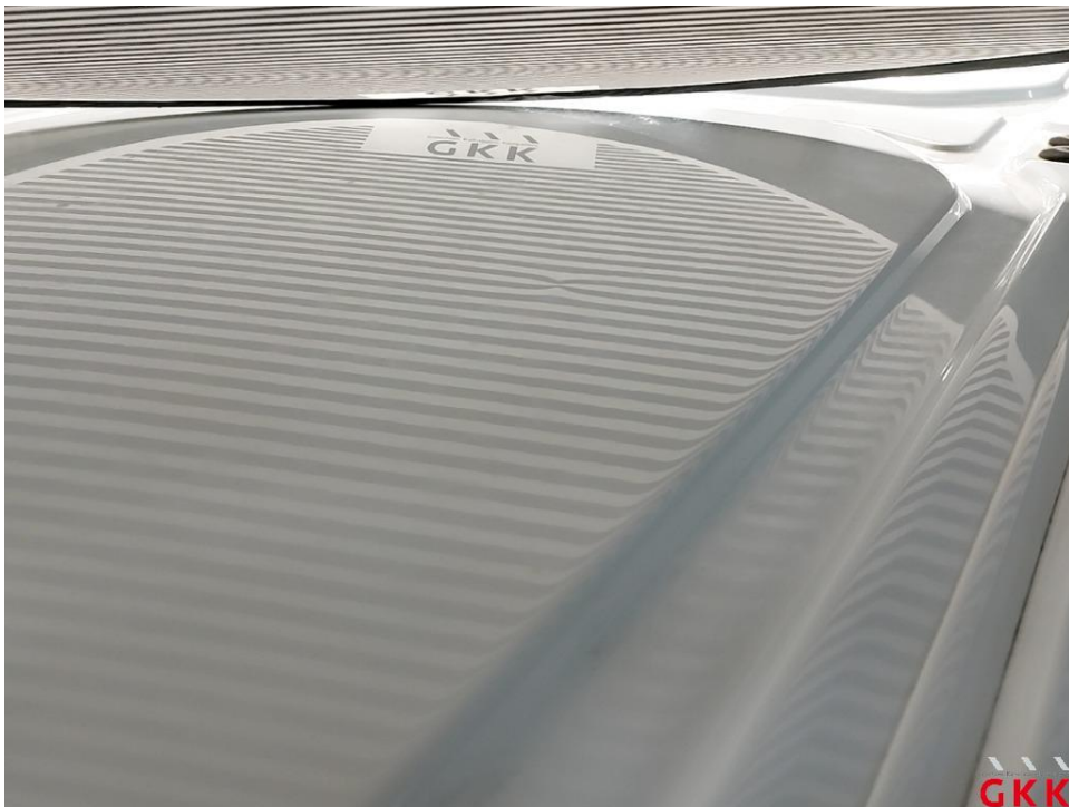
Bild 14 Dach, beschädigt, kalt drücken