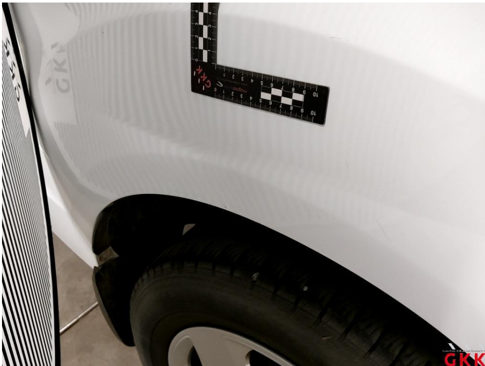
Bild 16 Seitenwand rechts, hinten -unterhalb-, beschädigt, instand setzen