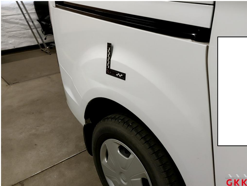
Bild 15 Seitenwand rechts, hinten -unterhalb-, beschädigt, instand setzen