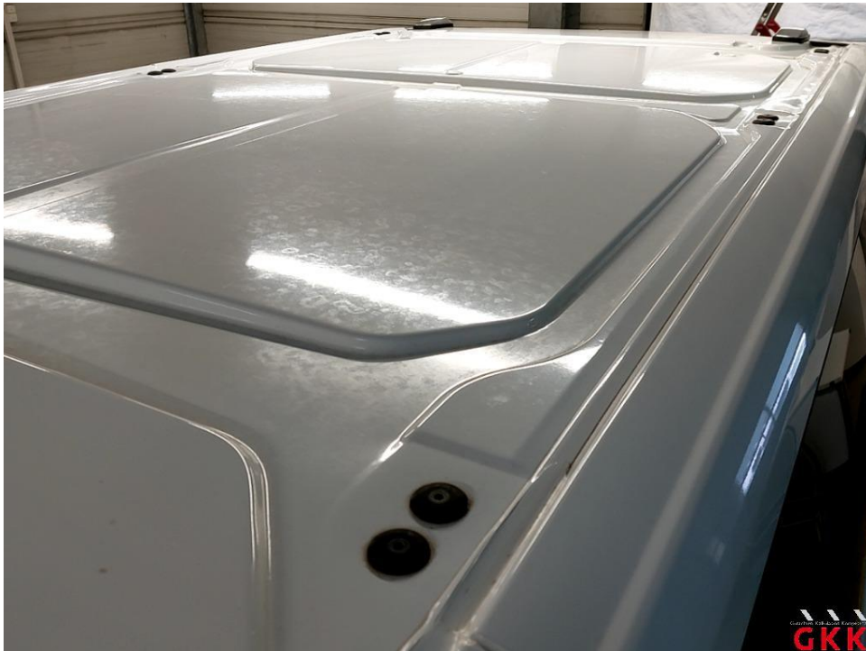
Bild 13 Dach, beschädigt, kalt drücken