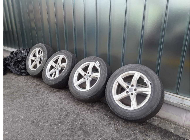
Abbildung 14: Zusatzbereifung