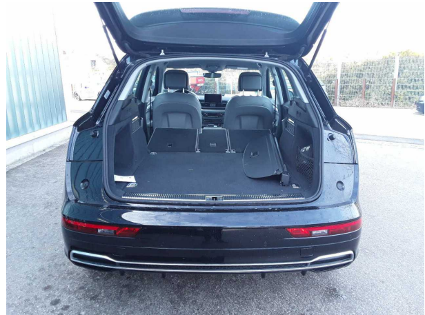
Abbildung 8: Laderaum