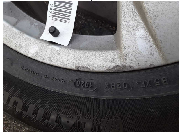
Beschädigung #3: 2.Radsatz: 1 Leichtmetallfelge (Materialabrieb) - verkratzt / verschürft - erneuern