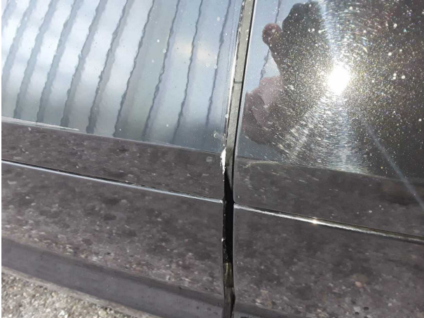
Beschädigung #1: Tür vorn links: Türkante - verkratzt / verschürft... Smart Repair