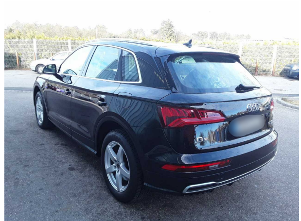
Abbildung 4: Schräg hinten