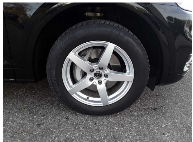
Abbildung 6: Montierte Bereifung