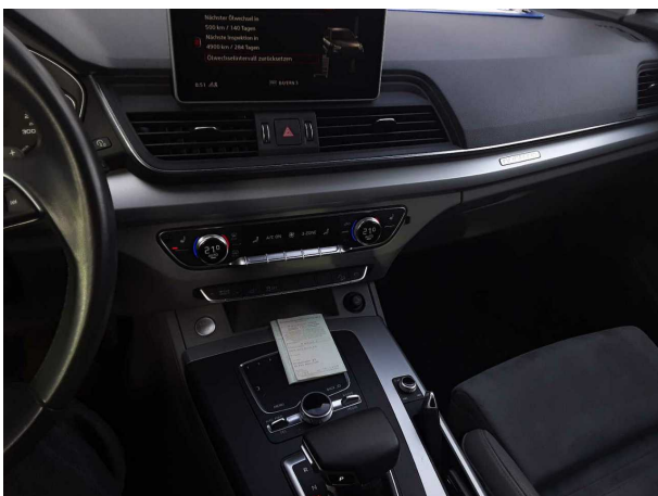
Abbildung 11: Instrumententafel