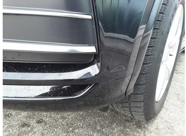
Beschädigung #2: Stossfänger vorn: Stossfänger vorn - verkratzt / verschürft - Smart Repair