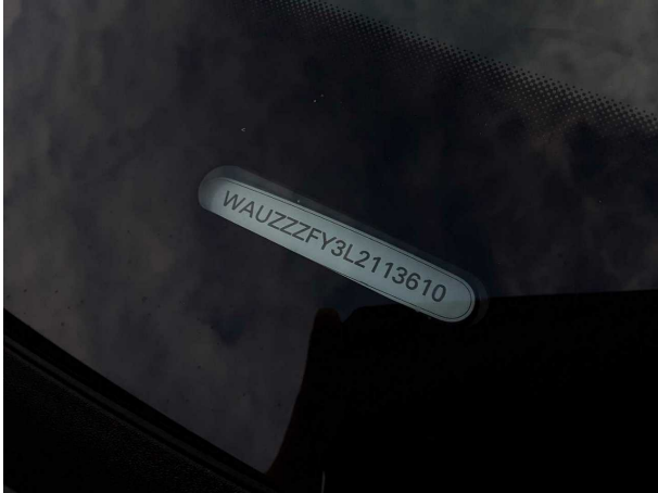
Abbildung 1: FIN