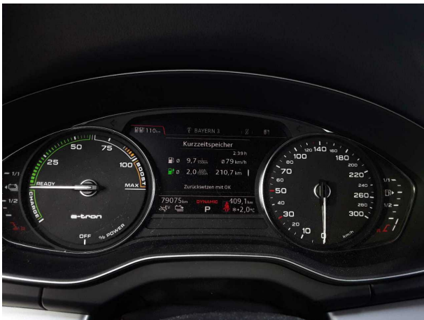
Abbildung 9: Kombiinstrument