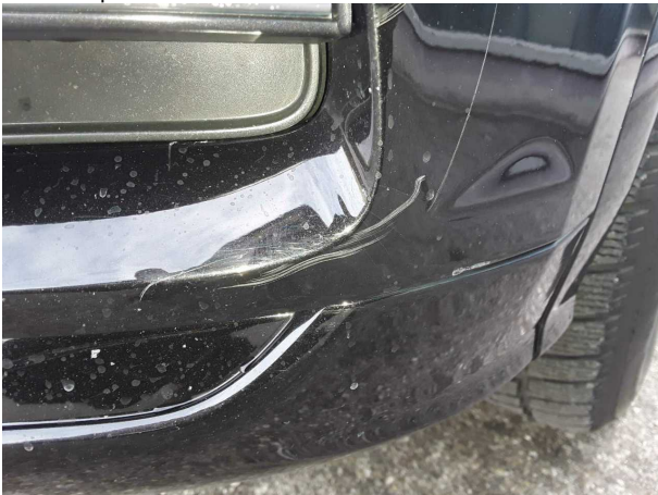
Beschädigung #2: Stossfänger vorn: Stossfänger vorn - verkratzt / verschürft - Smart Repair