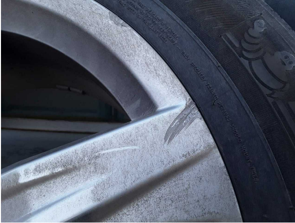
Beschädigung #3: 2.Radsatz: 1 Leichtmetallfelge (Materialabrieb) - verkratzt / verschürft - erneuern