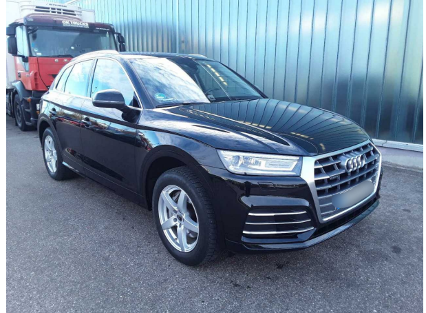
Abbildung 2: Schräg vorne