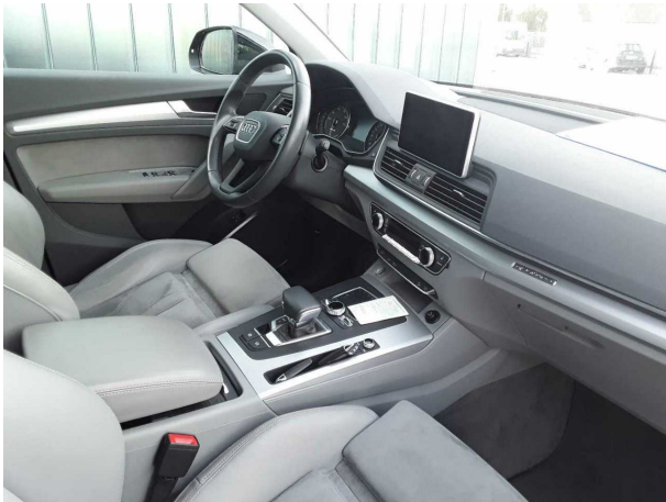
Abbildung 7: Innenraum vorne