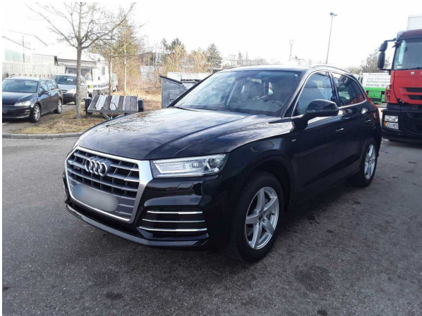
Abbildung 3: Schräg vorne