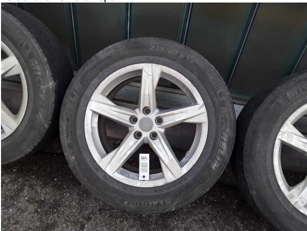
Beschädigung #3: 2.Radsatz: 1 Leichtmetallfelge (Materialabrieb) - verkratzt / verschürft - erneuern