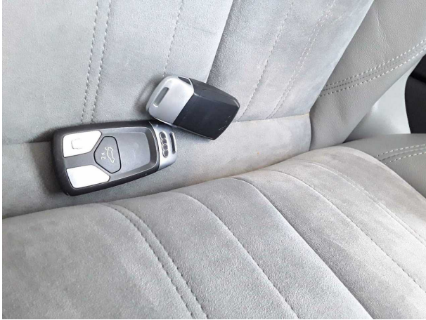
Abbildung 13: Dokumente