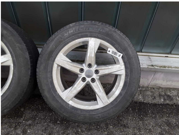
Abbildung 15: Zusatzbereifung