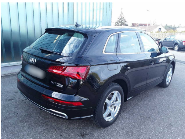
Abbildung 5: Schräg hinten