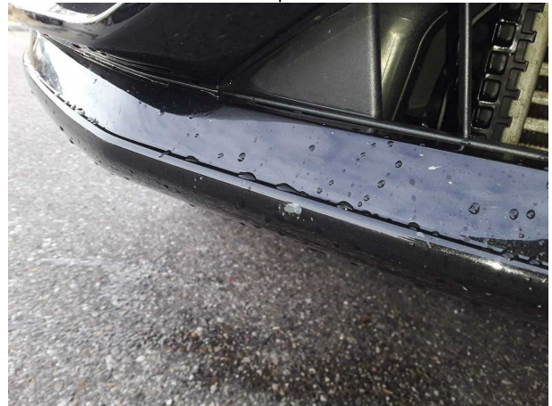
Beschädigung #2: Stossfänger vorn: Stossfänger vorn - verkratzt / verschürft - Smart Repair