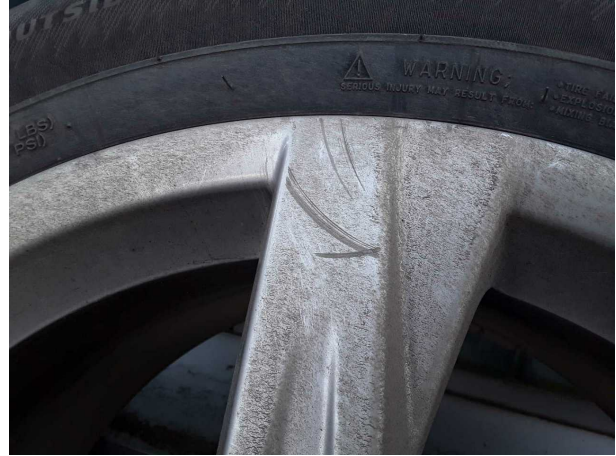
Beschädigung #3: 2.Radsatz: 1 Leichtmetallfelge (Materialabrieb) - verkratzt / verschürft - erneuern