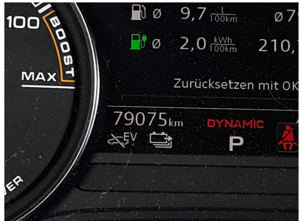
Abbildung 10: Kombiinstrument