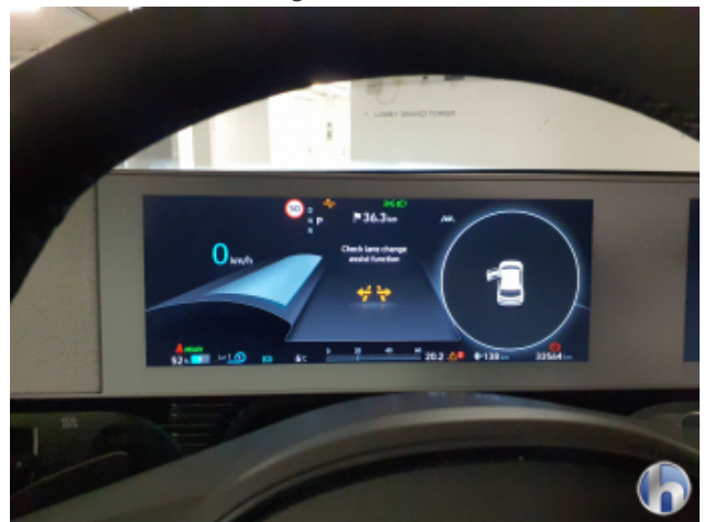
6. Assistenzsysteme Fehlermeldung - Fehler-diagnose Durchführen