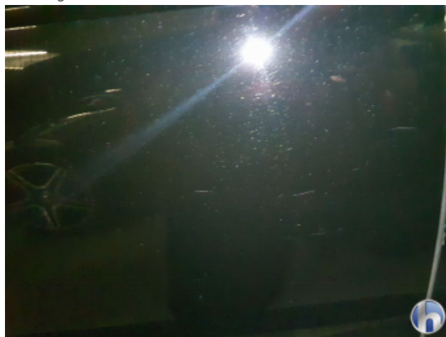
1. Tür Hinten - Rechts Kratzer - Lackieren