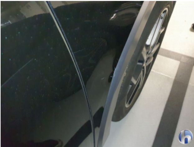
2. Kotflügel Vorne - Rechts Verdellt - Instandsetzen und Lackieren