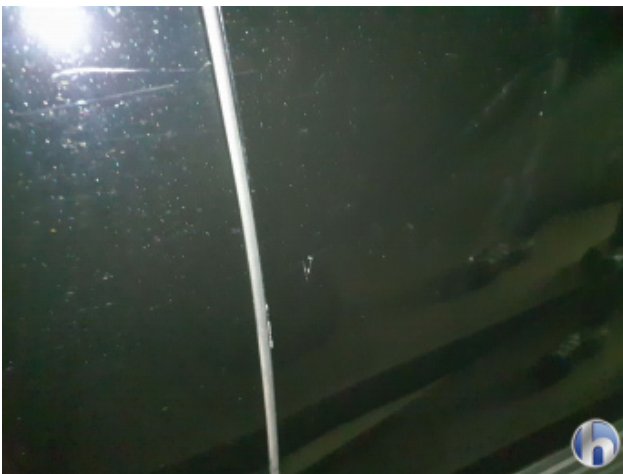
4. Tür Vorne - Rechts Kratzer - Smart Repair