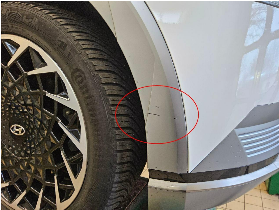
Bild 7 : Kotflügel vorne rechts Lackierung, verschrammt, smart repair