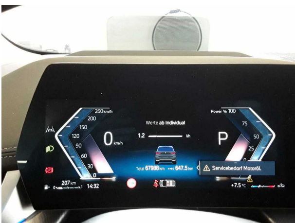
Illustration 17: Divers