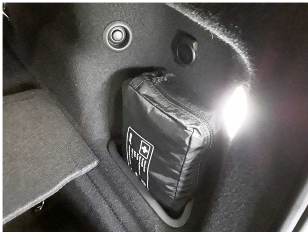
Illustration 21: Divers