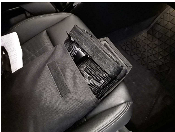
Illustration 11: Divers