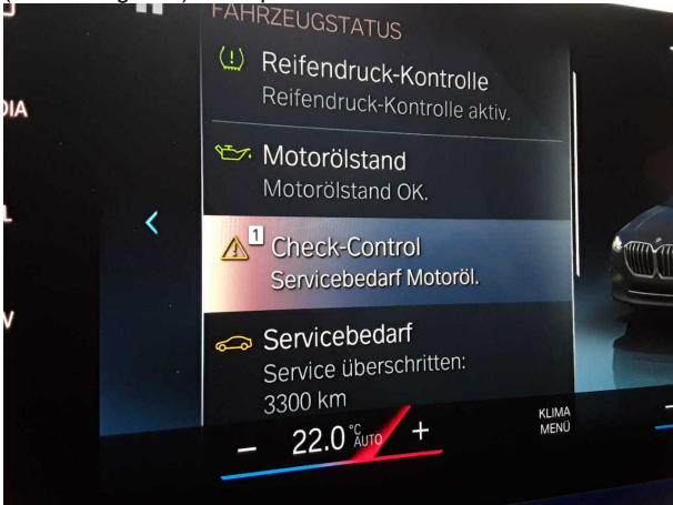
Domage #3: Divers: Inspection / Maintenance - Exigible - Remplacer