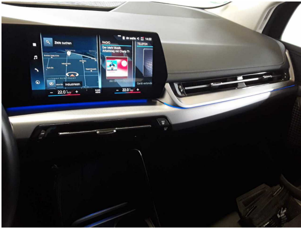
Illustration 7: Habitable