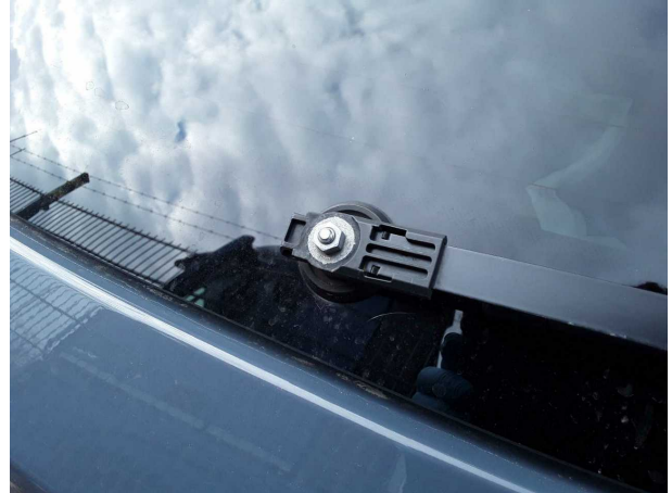
Domage #2: Nettoyage des vitres: Bras d'essuie-glace arrière (Abdeckung fehlt) - Remplacer