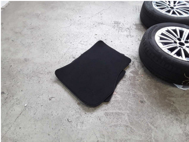
Illustration 13: Divers