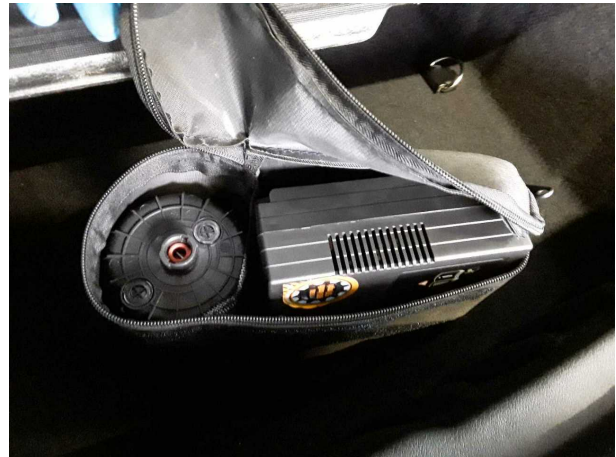
Illustration 20: Divers