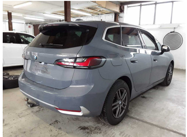
Illustration 4: Incliné à l'arrière