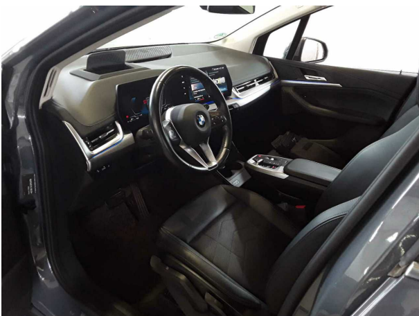
Illustration 5: Habitacle