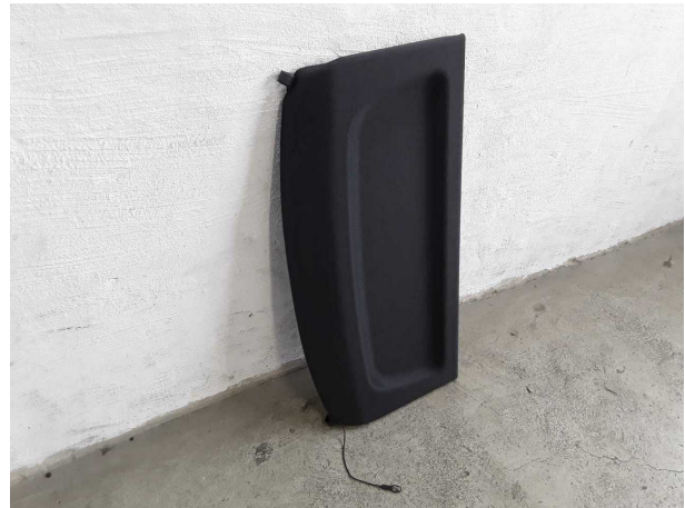
Illustration 14: Divers