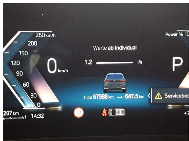
Illustration 18: Divers