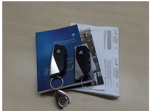
Illustration 10: Divers