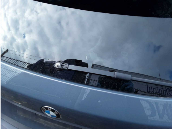
Domage #2: Nettoyage des vitres: Bras d'essuie-glace arrière (Abdeckung fehlt) - Remplacer