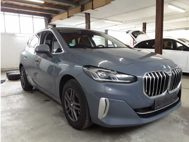
Illustration 1: Incliné à l'avant