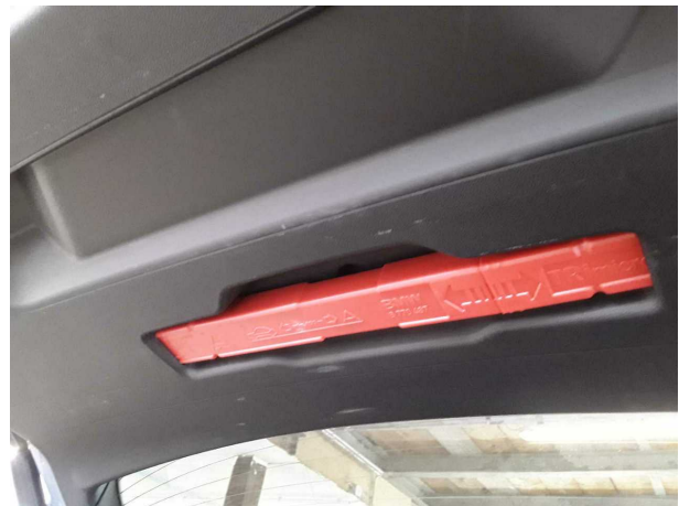
Illustration 22: Divers