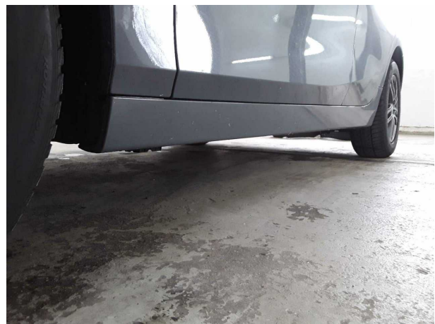
Illustration 16: Divers