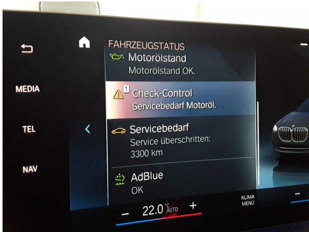
Illustration 19: Divers