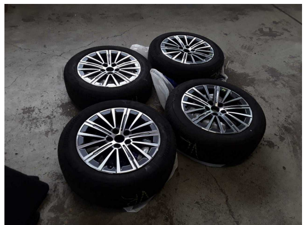
Illustration 12: Divers