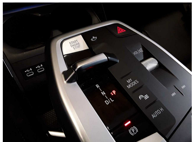
Illustration 6: Habitacle