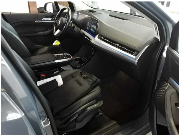
Illustration 9: Habitable