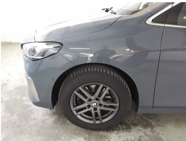
Illustration 15: Divers