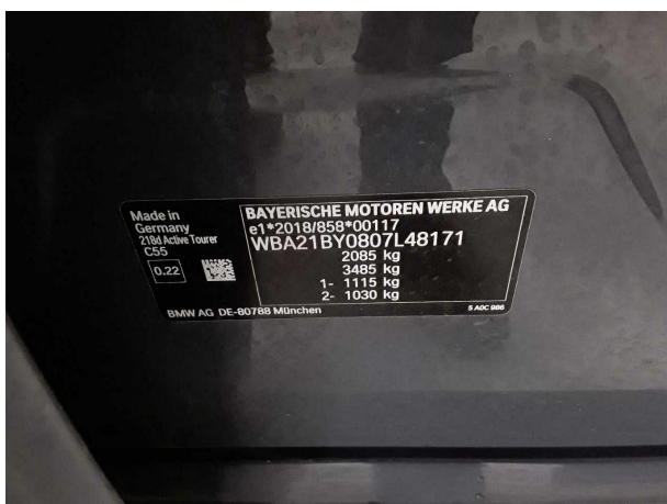
Illustration 23: Divers