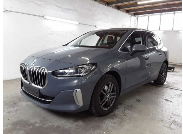
Illustration 2: Incliné à l'avant