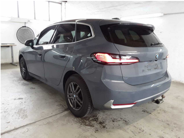
Illustration 3: Incliné à l'arrière