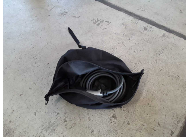
Abbildung 20: Sonstiges