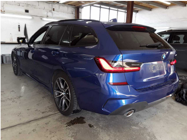
Abbildung 3: Schräg hinten