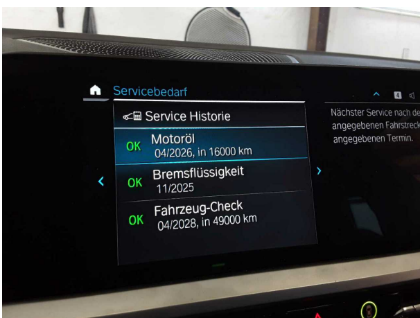
Abbildung 17: Sonstiges