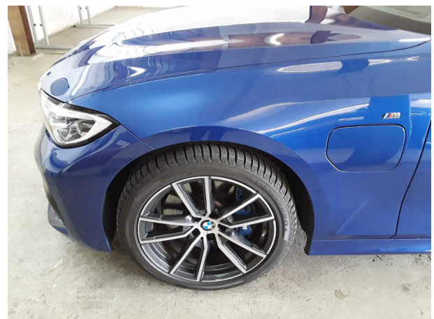
Abbildung 12: Sonstiges