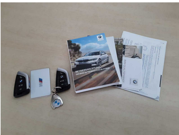
Abbildung 11: Sonstiges