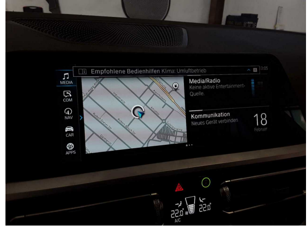
Abbildung 8: Innenraum