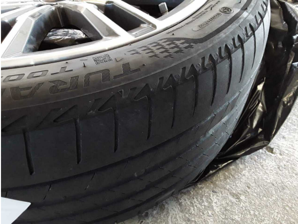
Beschädigung #1: Vermessung: Fahrwerk - Fehlstellung - einstellen/justieren