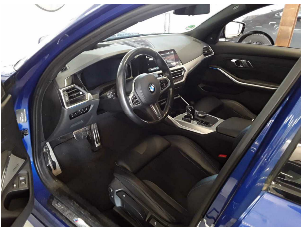
Abbildung 5: Innenraum