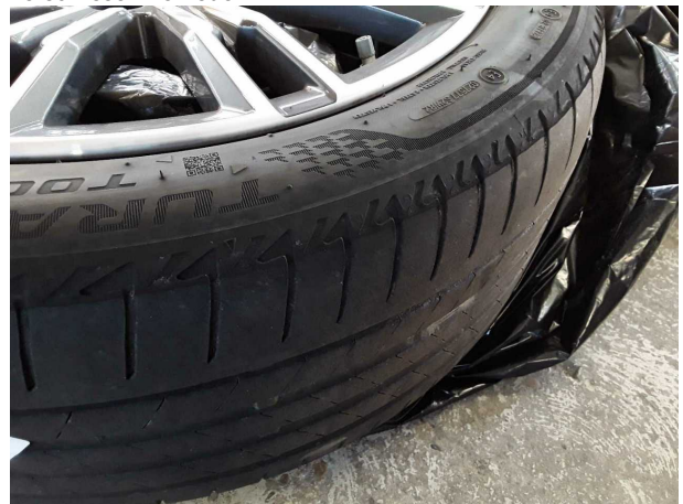
Beschädigung #2: 2.Radsatz: 2 Reifen (Seitlich abgefahren) - verschlissen - erneuern