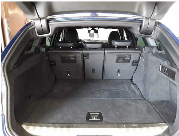
Abbildung 21: Sonstiges