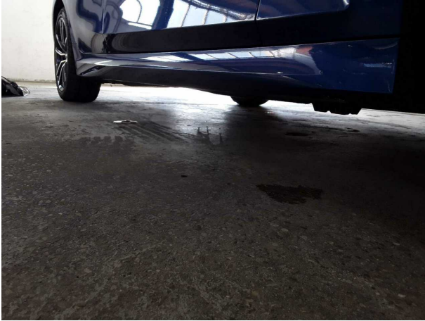
Abbildung 25: Sonstiges