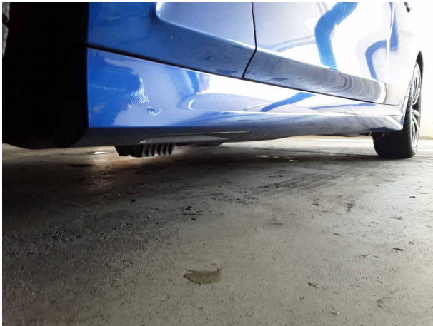
Abbildung 13: Sonstiges