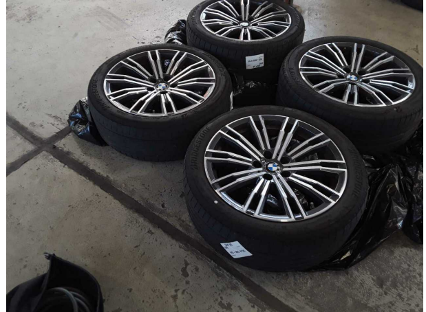
Beschädigung #2: 2.Radsatz: 2 Reifen (Seitlich abgefahren) - verschlissen - erneuern