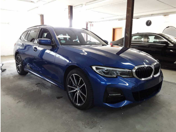
Abbildung 1: Schräg vorne