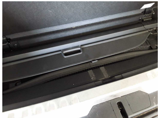
Abbildung 22: Sonstiges