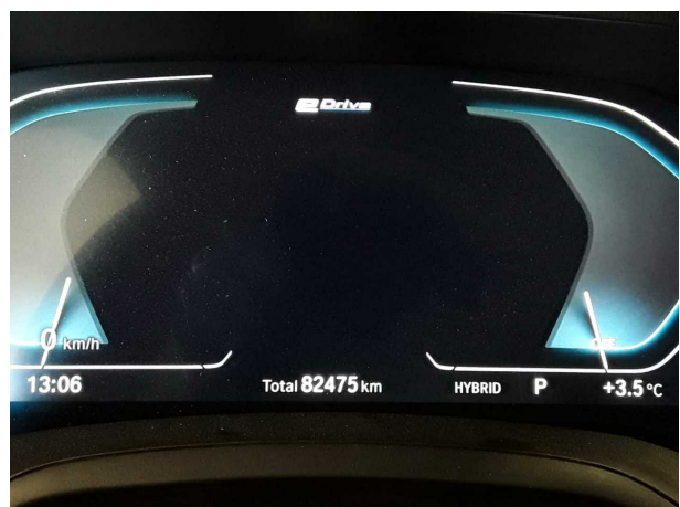
Abbildung 18: Sonstiges