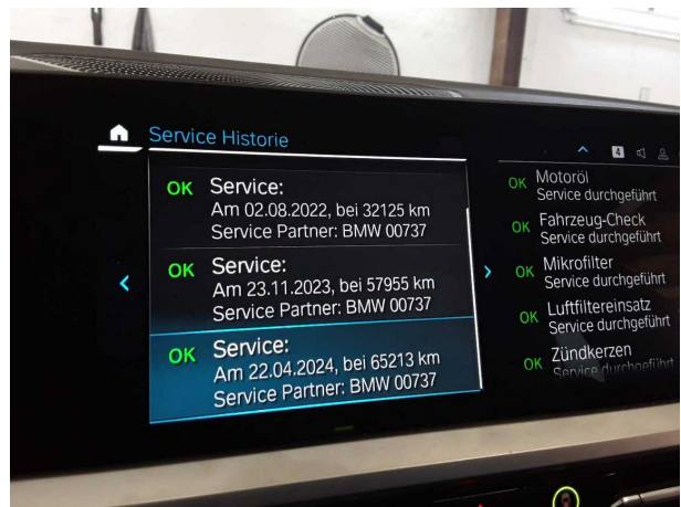
Abbildung 16: Sonstiges