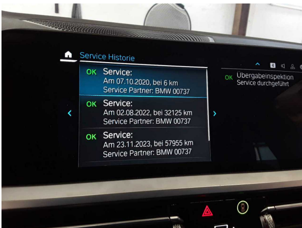
Abbildung 15: Sonstiges