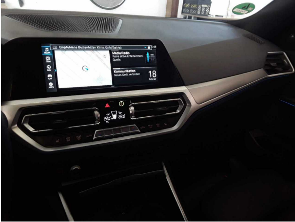
Abbildung 7: Innenraum