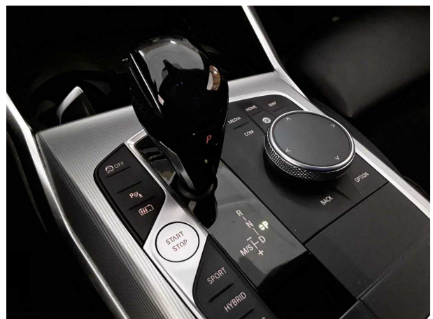
Abbildung 6: Innenraum