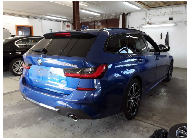
Abbildung 4: Schräg hinten