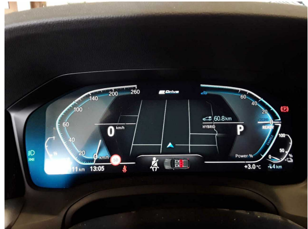
Abbildung 14: Sonstiges