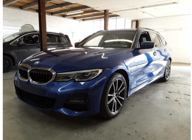
Abbildung 2: Schräg vorne