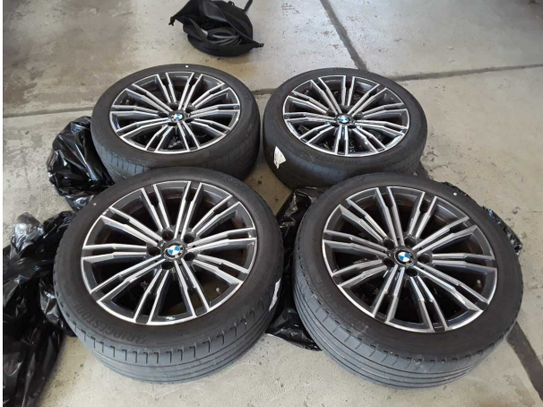
Abbildung 19: Sonstiges