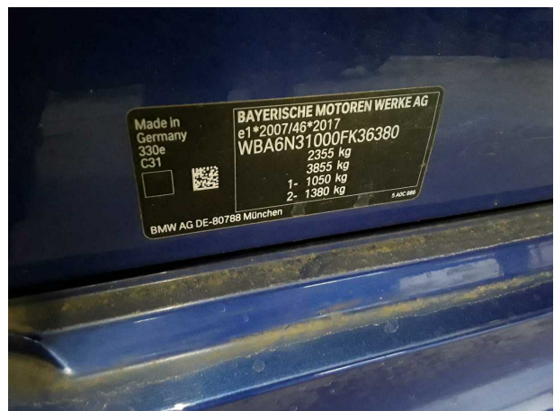
Abbildung 24: Sonstiges