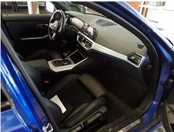
Abbildung 9: Innenraum