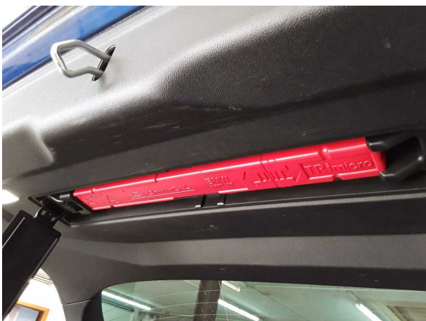
Abbildung 23: Sonstiges