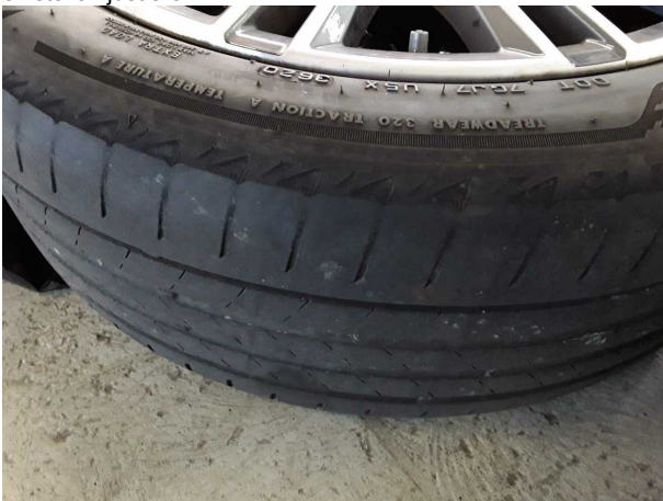
Beschädigung #2: 2.Radsatz: 2 Reifen (Seitlich abgefahren) - verschlissen - erneuern