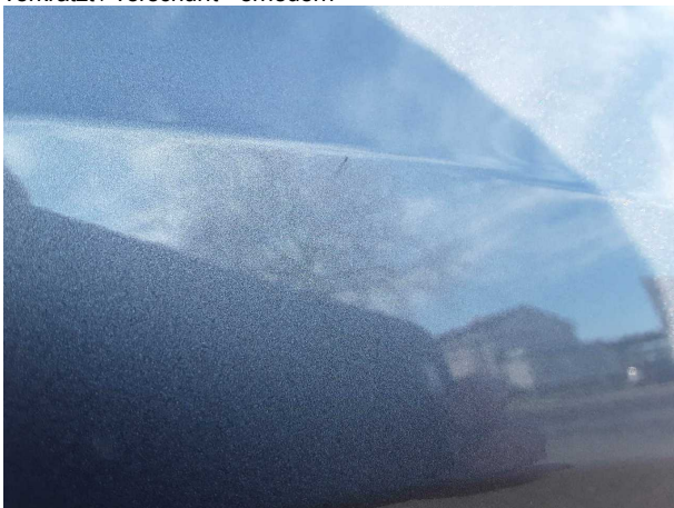
Beschädigung #3: Seitenwand links: Seitenwand - Delle / Lackschaden - Smart Repair