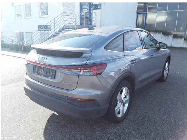
Abbildung 5: Schräg hinten