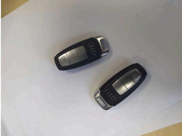
Abbildung 13: Dokumente