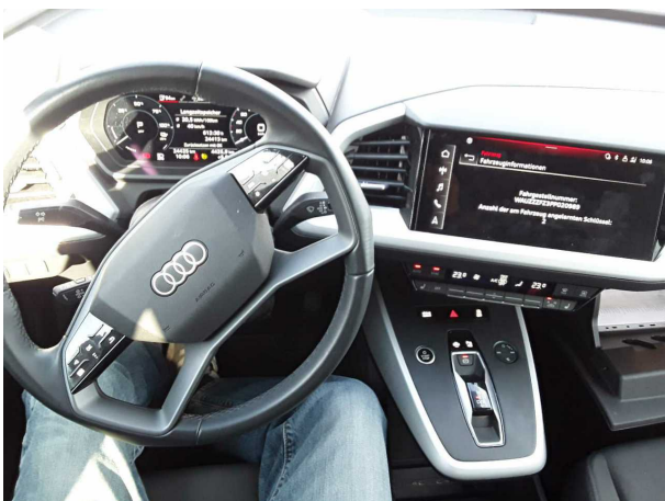
Abbildung 11: Instrumententafel