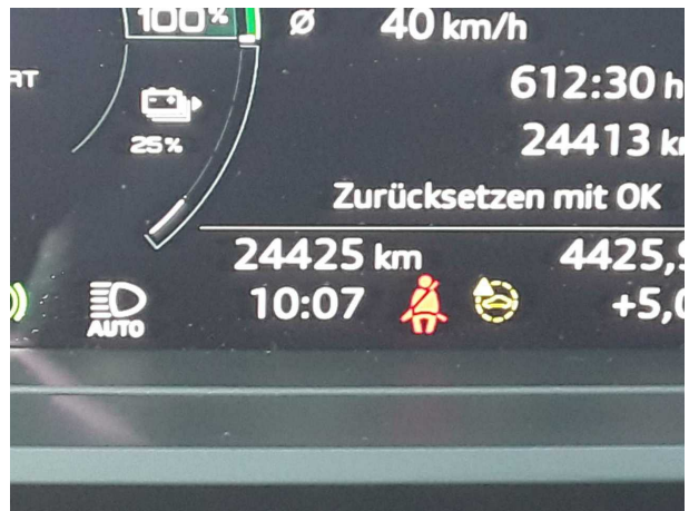
Abbildung 10: Kombiinstrument