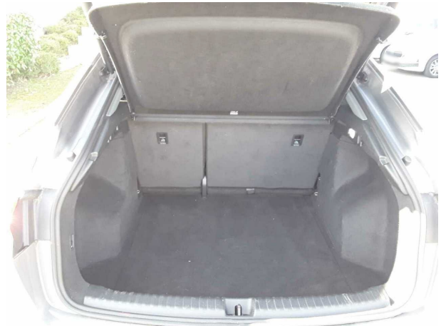
Abbildung 8: Laderaum