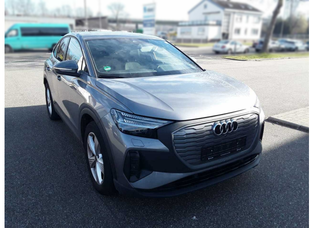
Abbildung 2: Schräg vorne