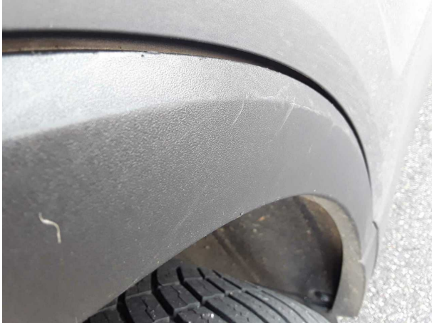
Beschädigung #2: Seitenwand rechts: Radhausverbreiterung - verkratzt / verschürft - erneuern