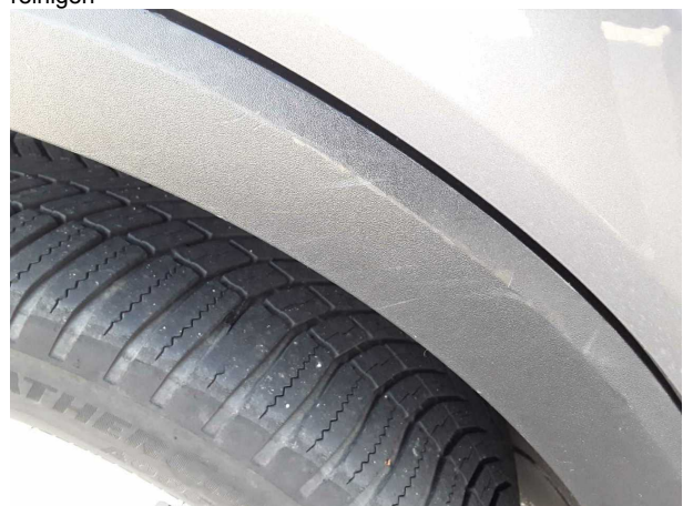
Beschädigung #2: Seitenwand rechts: Radhausverbreiterun... verkratzt / verschürft - erneuern