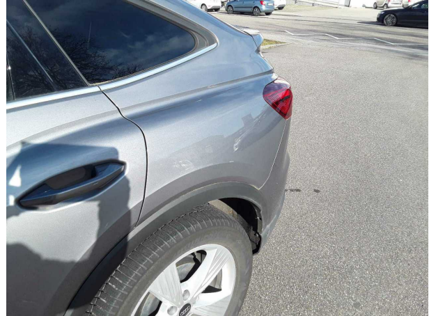
Beschädigung #3: Seitenwand links: Seitenwand - Delle / Lackschaden - Smart Repair