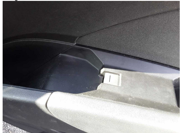
Beschädigung #1: Interieur: Innenraum - verschmutzt - reinigen