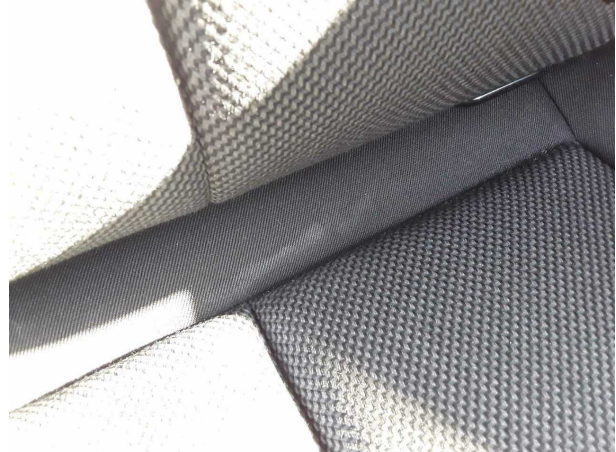
Beschädigung #1: Interieur: Innenraum - verschmutzt - reinigen