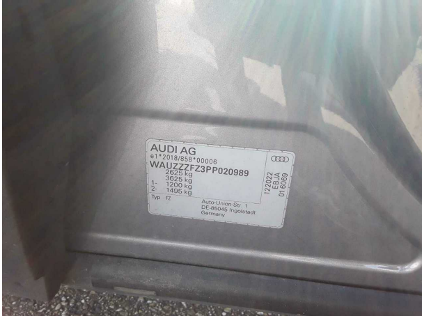
Abbildung 1: FIN