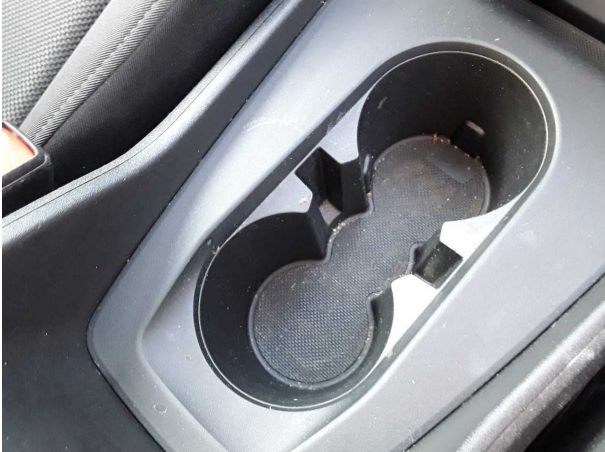
Beschädigung #1: Interieur: Innenraum - verschmutzt - reinigen