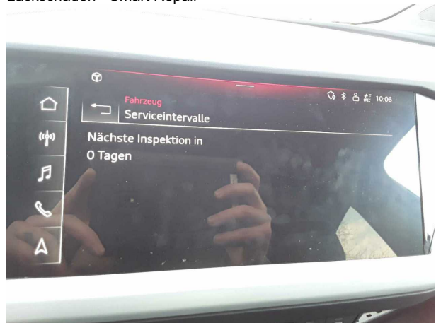
Beschädigung #4: Sonstiges: Inspektion/Wartung - fällig - erneuern