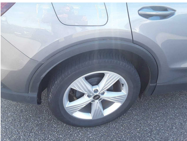
Beschädigung #2: Seitenwand rechts: Radhausverbreiterung - verkratzt / verschürft - erneuern