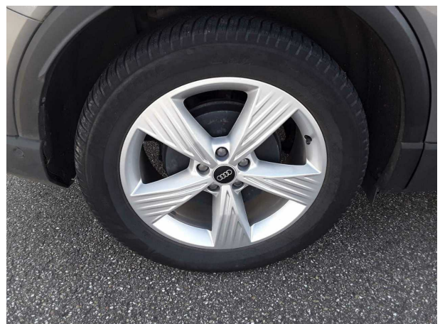
Abbildung 6: Montierte Bereifung