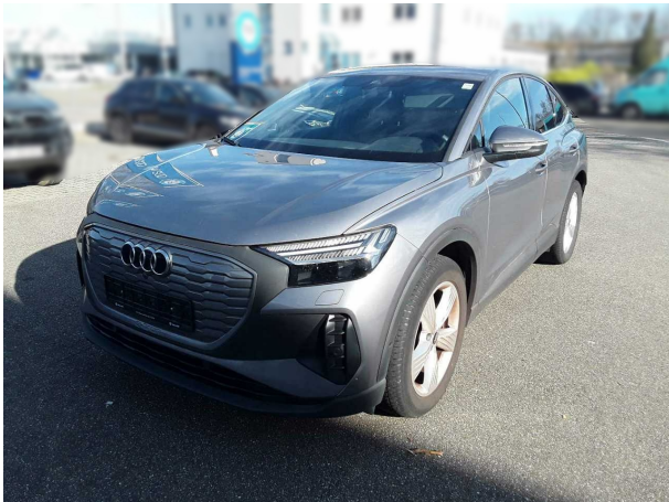
Abbildung 3: Schräg vorne