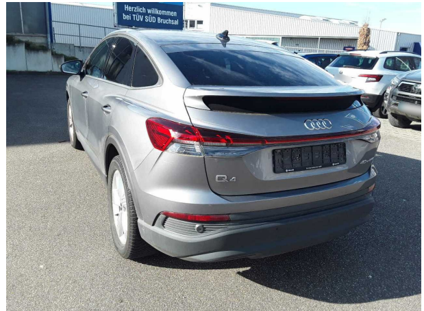
Abbildung 4: Schräg hinten