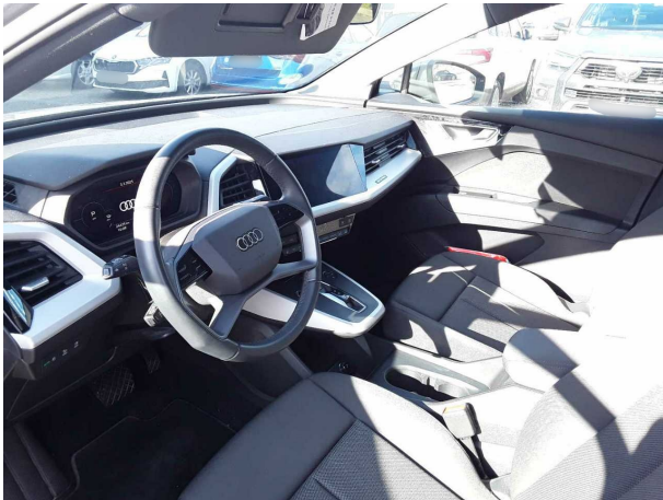
Abbildung 7: Innenraum vorne