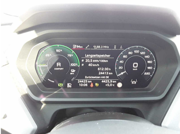
Abbildung 9: Kombiinstrument