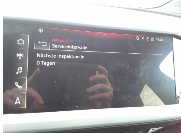
Abbildung 14: Sonstiges