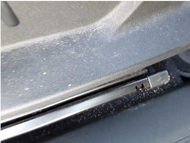
Beschädigung #1: Interieur: Innenraum - verschmutzt - reinigen