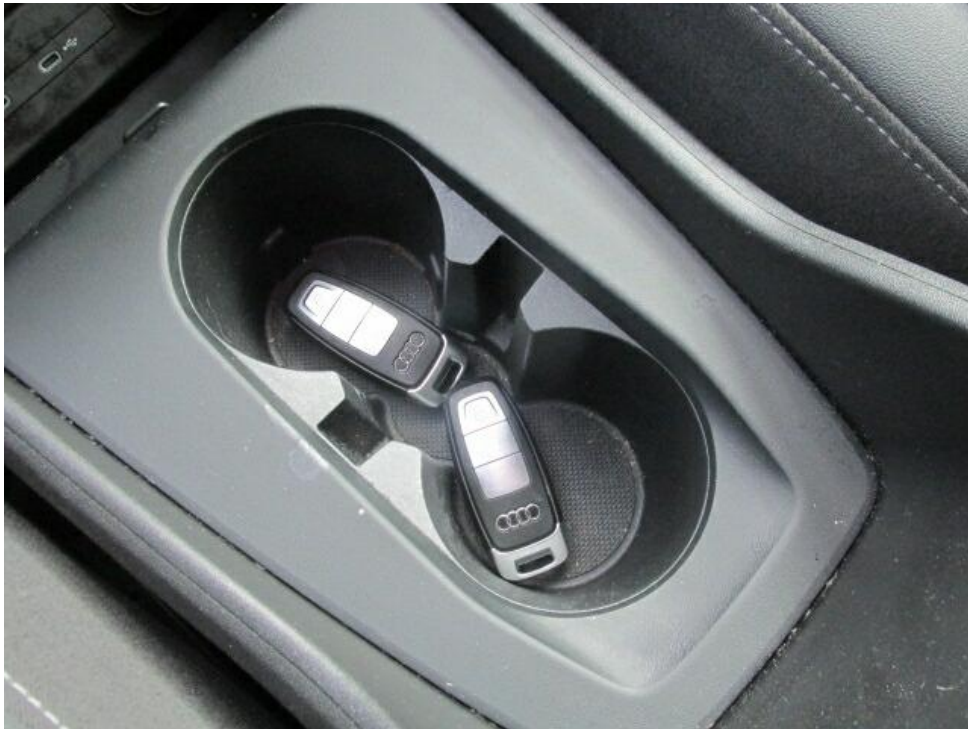
Bild 11 : Serviceheft letzter Eintrag, alle Fahrzeugschlüssel, Bordmappe