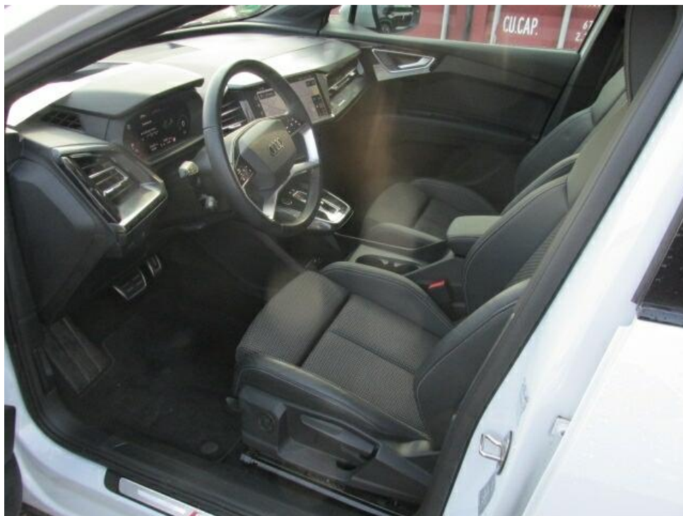
Bild 8 : Durch geöffnete Fahrertüre: Fahrersitz, Armaturenbrett und Schalthebel