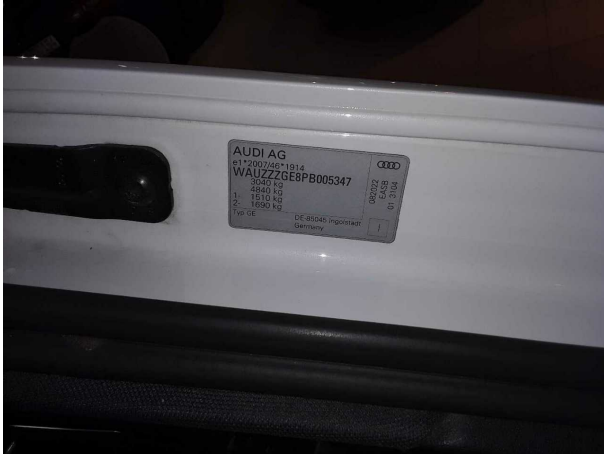
Abbildung 1: FIN