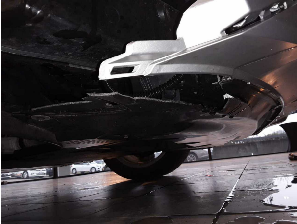
Unfall 1: Front