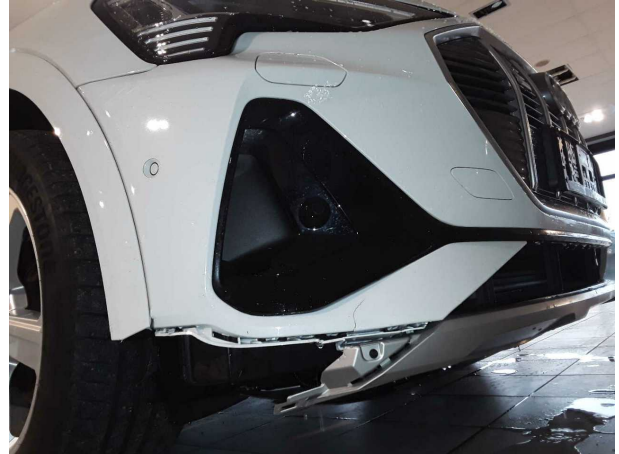
Unfall 1: Front