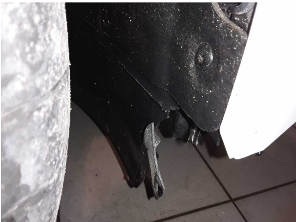
Unfall 1: Front