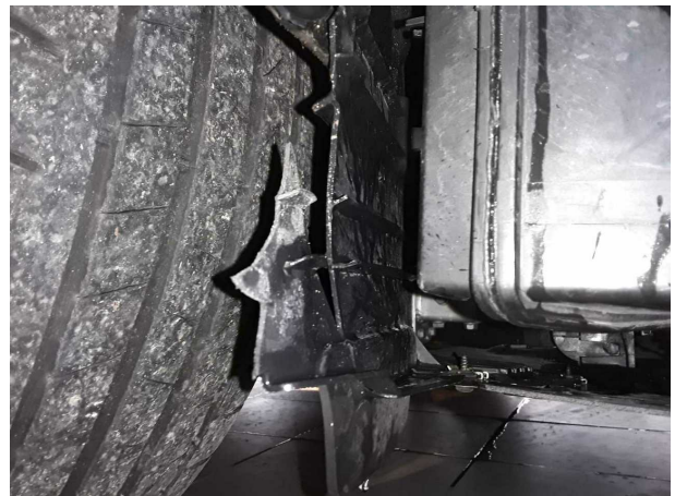
Unfall 1: Front