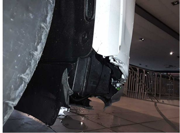
Unfall 1: Front