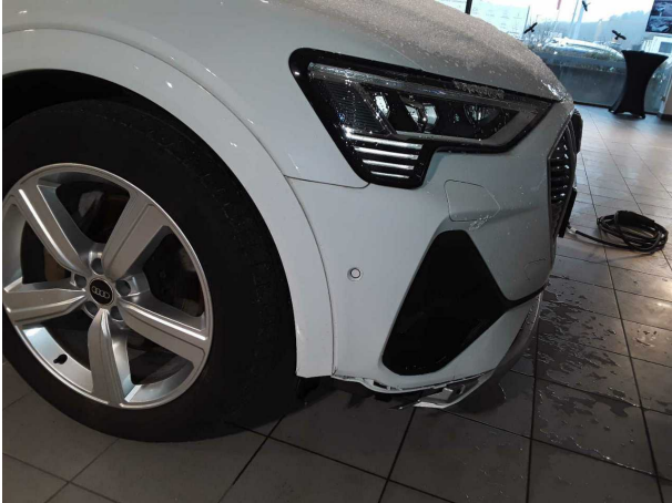
Unfall 1: Front