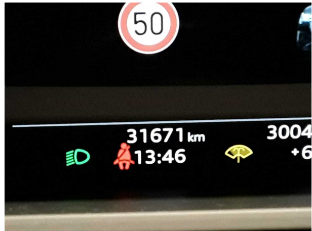
Abbildung 10: Kombiinstrument