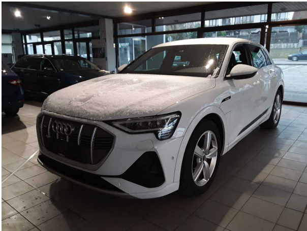
Abbildung 3: Schräg vorne