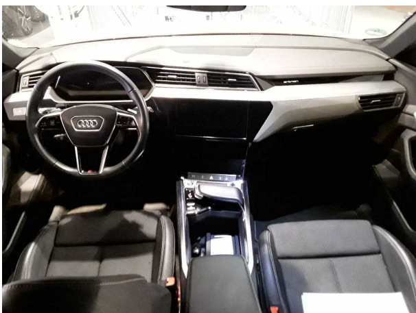
Abbildung 11: Instrumententafel