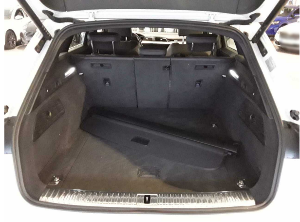
Abbildung 8: Laderaum