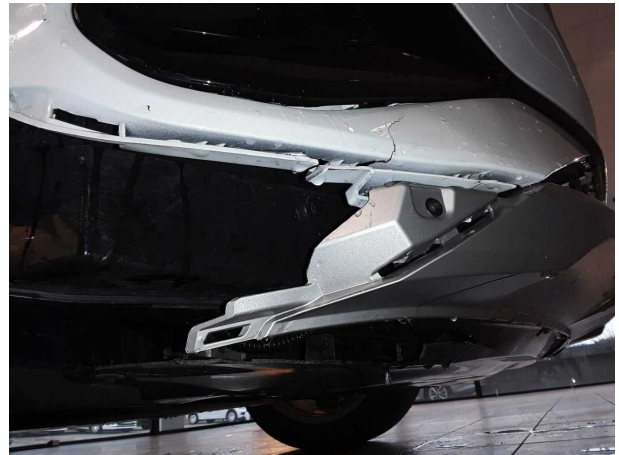
Unfall 1: Front