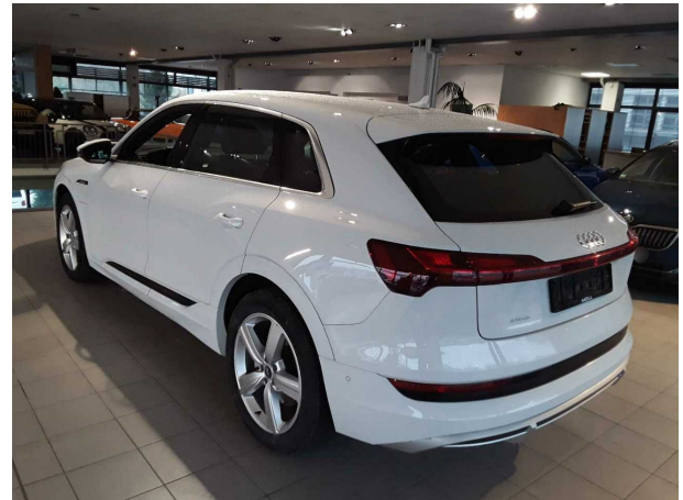
Abbildung 4: Schräg hinten