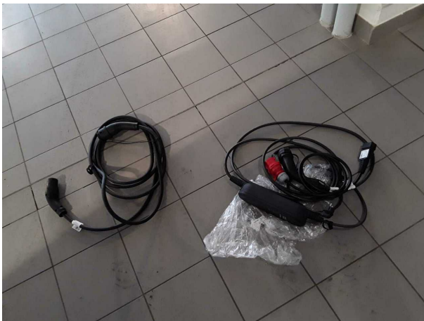
Abbildung 15: Sonstiges