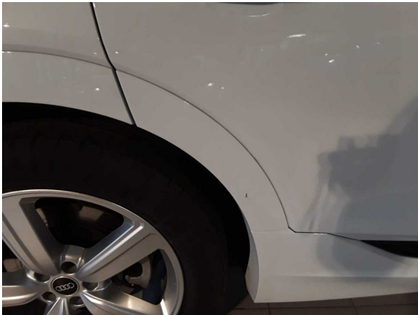
Beschädigung #1: Seitenwand rechts: Radhausverbreiterung - verkratzt / verschürft - Smart Repair