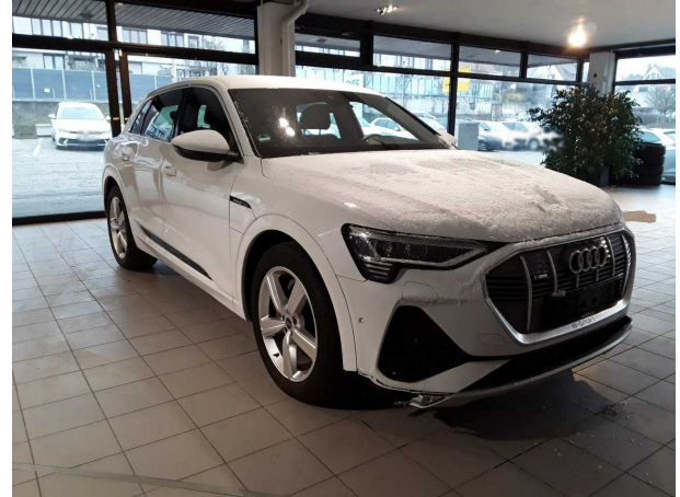
Abbildung 2: Schräg vorne