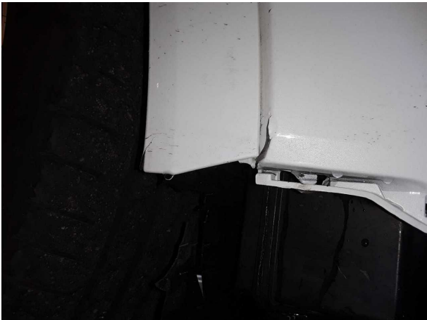
Unfall 1: Front