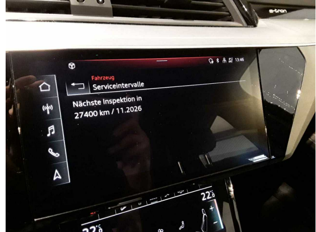
Abbildung 14: Sonstiges