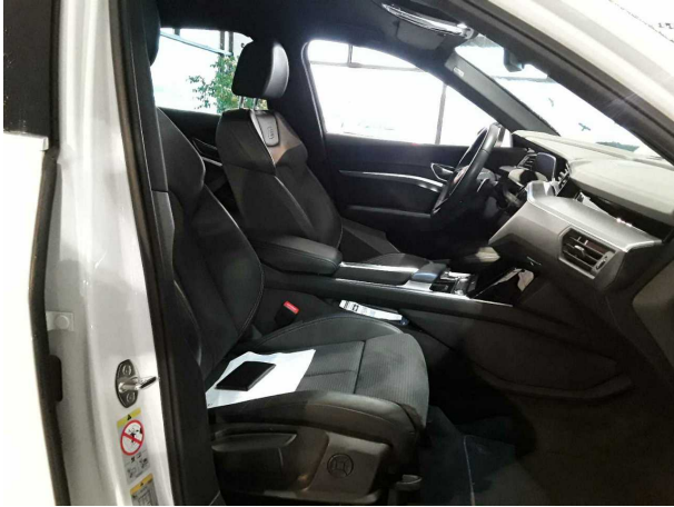
Abbildung 7: Innenraum vorne