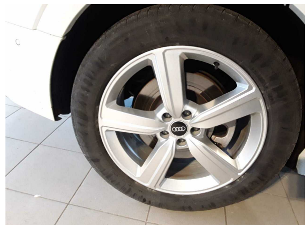
Abbildung 6: Montierte Bereifung