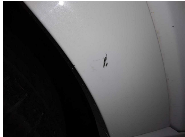
Beschädigung #1: Seitenwand rechts: Radhausverbreiterun... verkratzt / verschürft - Smart Repair