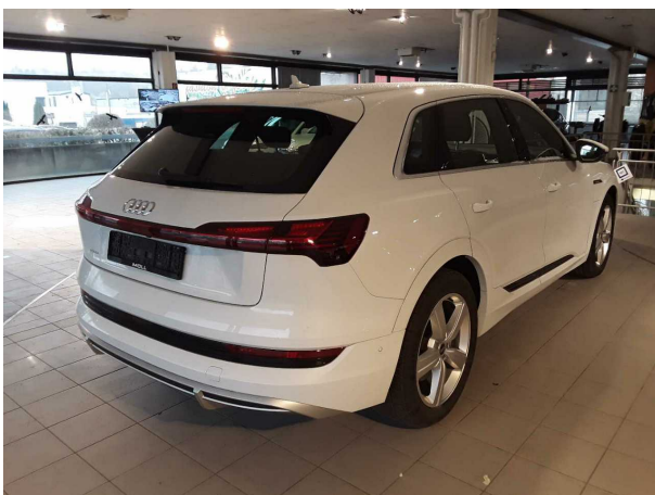
Abbildung 5: Schräg hinten