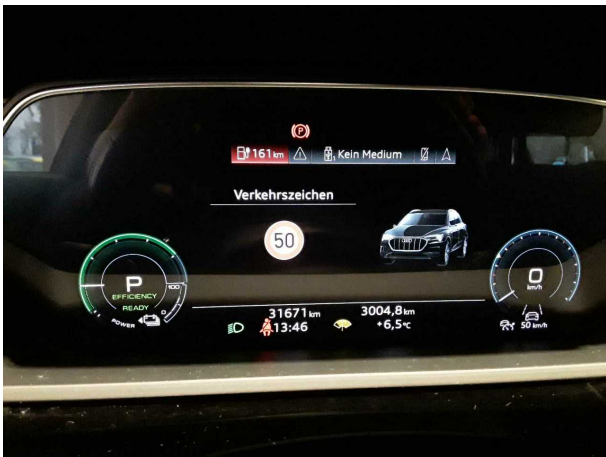
Abbildung 9: Kombiinstrument