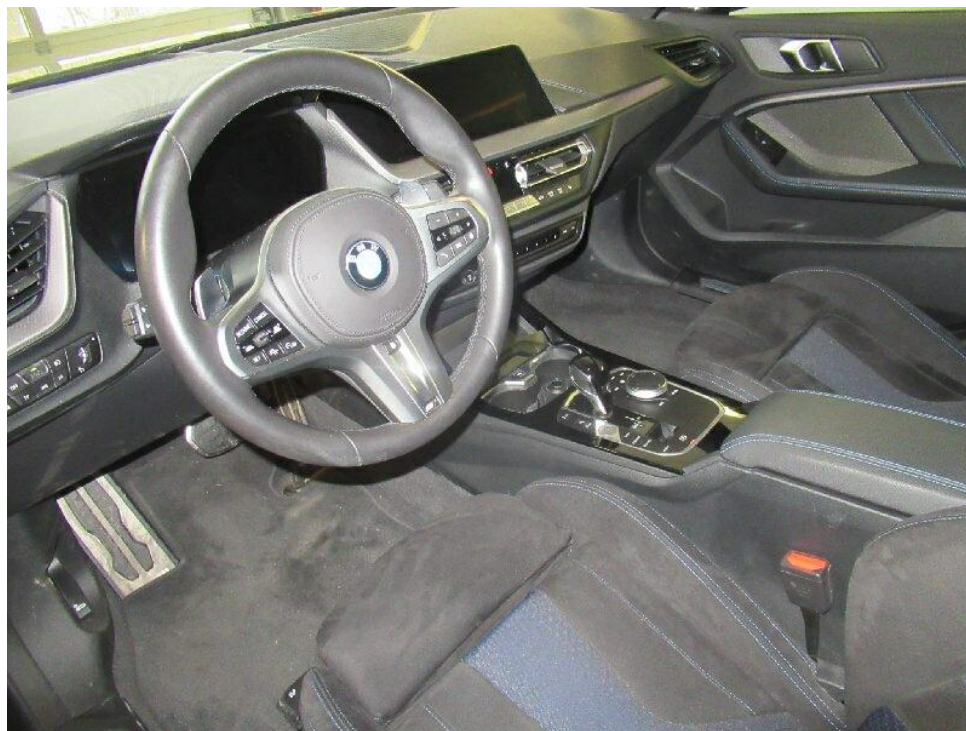
Bild 8 : Durch geöffnete Fahrertüre: Fahrersitz, Armaturenbrett und Schalthebel