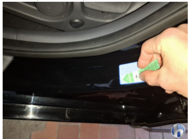
5. Türeinstieg lo.vo. Beschädigt - Smart Repair