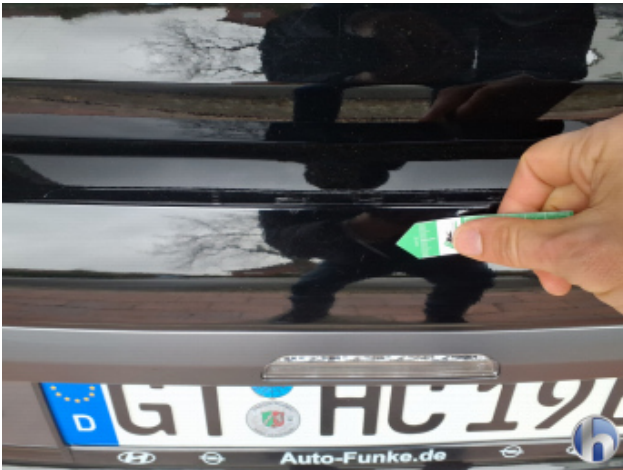
2. Stoßfänger Hinten Kratzer - Smart Repair