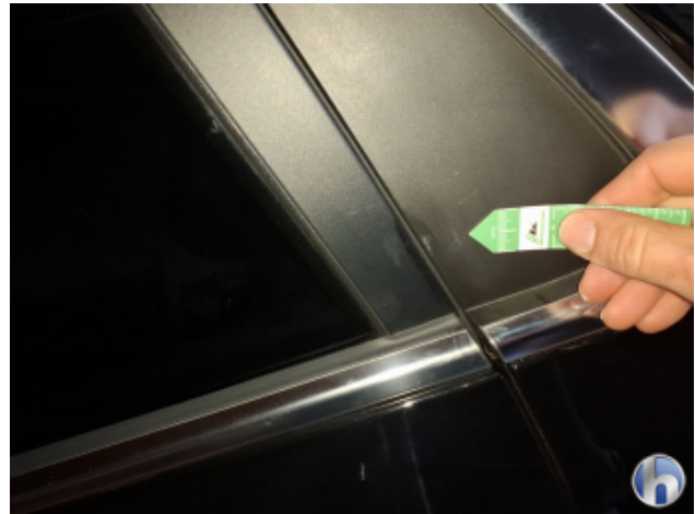
3. C-Säule Hinten - Links Gebrauchsspuren - Ohne Reparatur