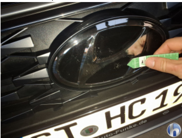
6. Emblem mit Fahraissist. Gebrauchsspuren - Ohne Reparatur