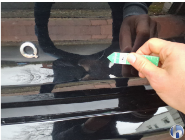
4. Heckklappenverkleidung Kratzer - Smart Repair