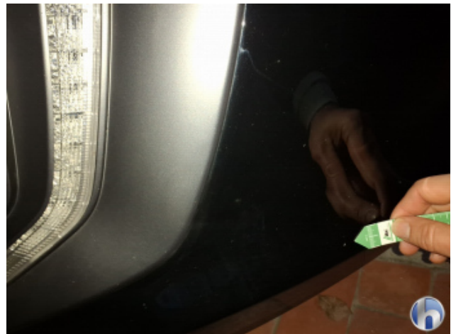
1. Stoßfänger Vorne Gebrauchsspuren - Ohne Reparatur