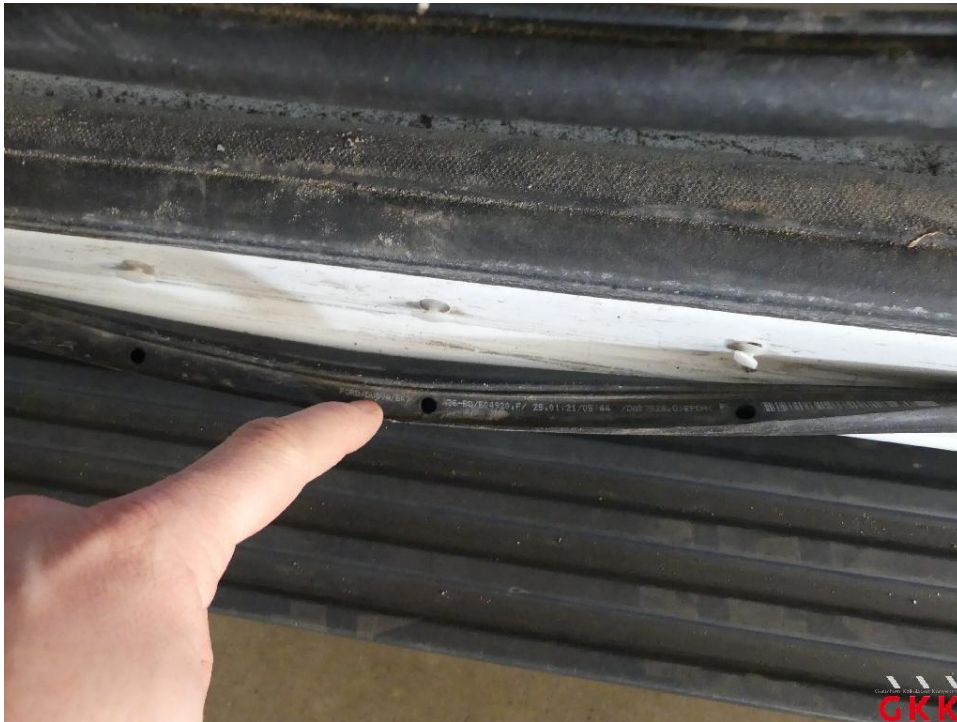
Bild 17 Schiebetür rechts, Dichtung -Einstieg-, lose, ersetzen