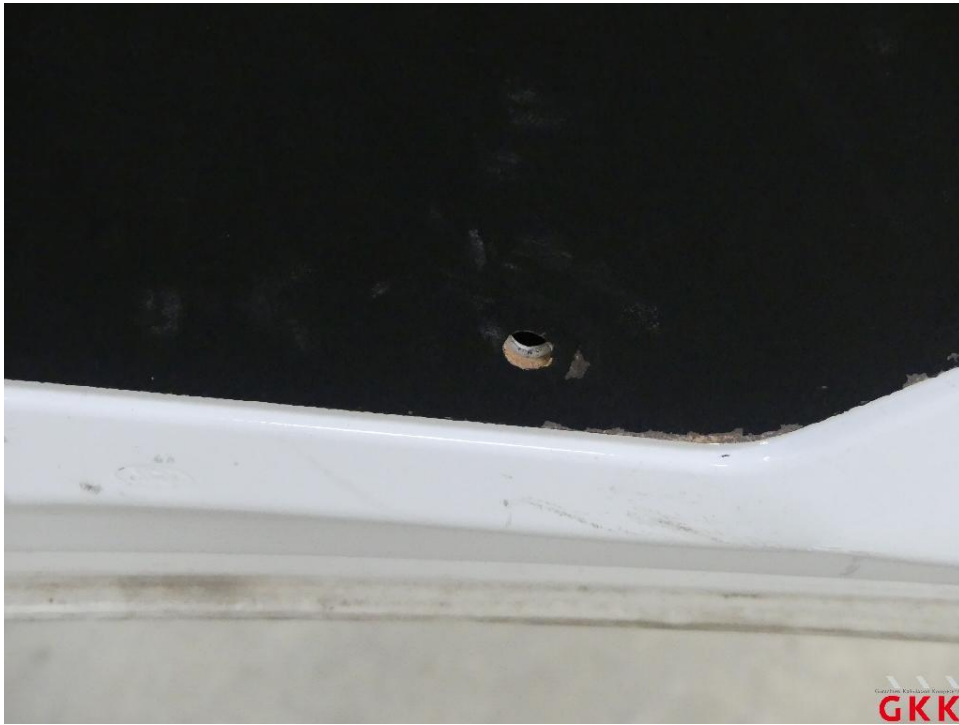
Bild 19 Hecktür rechts, Innenverkleidung, lose, instand setzen