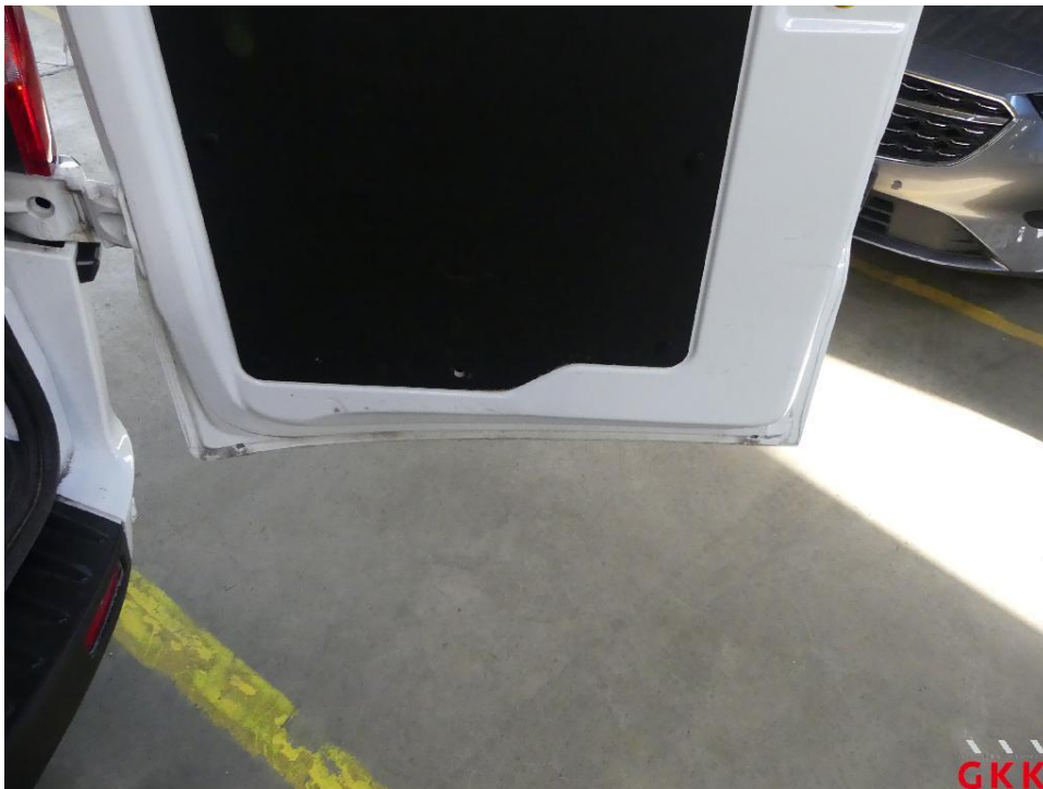
Bild 18 Hecktür rechts, Innenverkleidung, lose, instand setzen