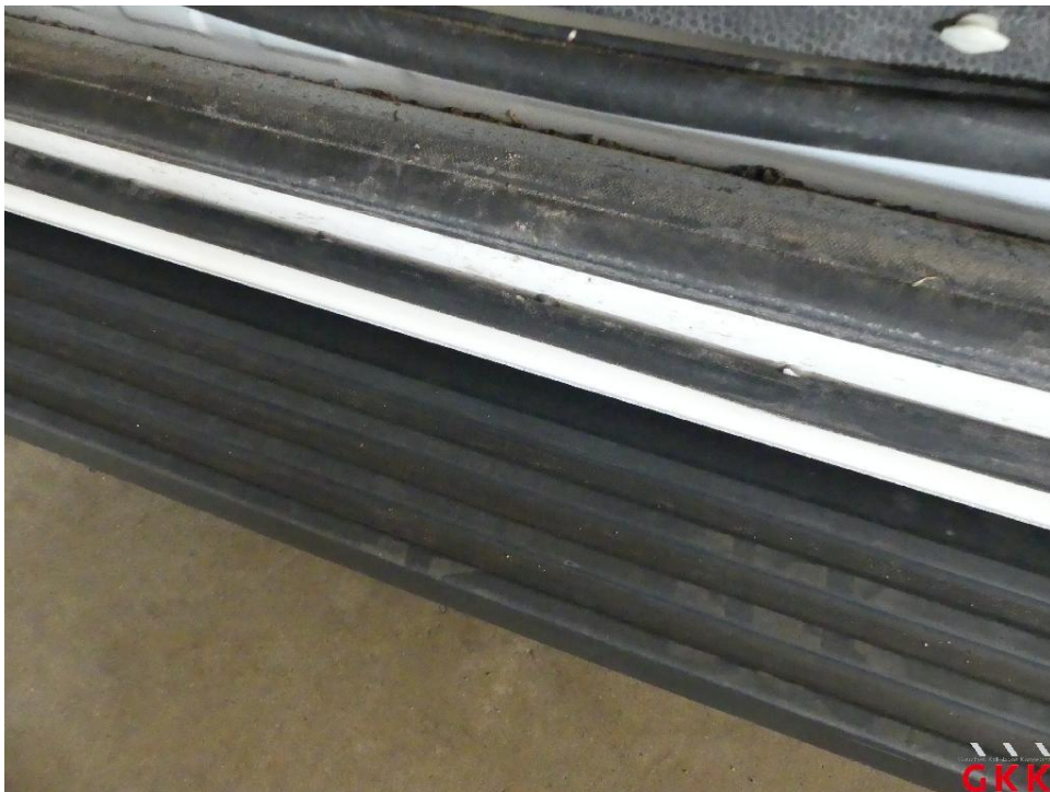
Bild 16 Schiebetür rechts, Dichtung -Einstieg-, lose, ersetzen