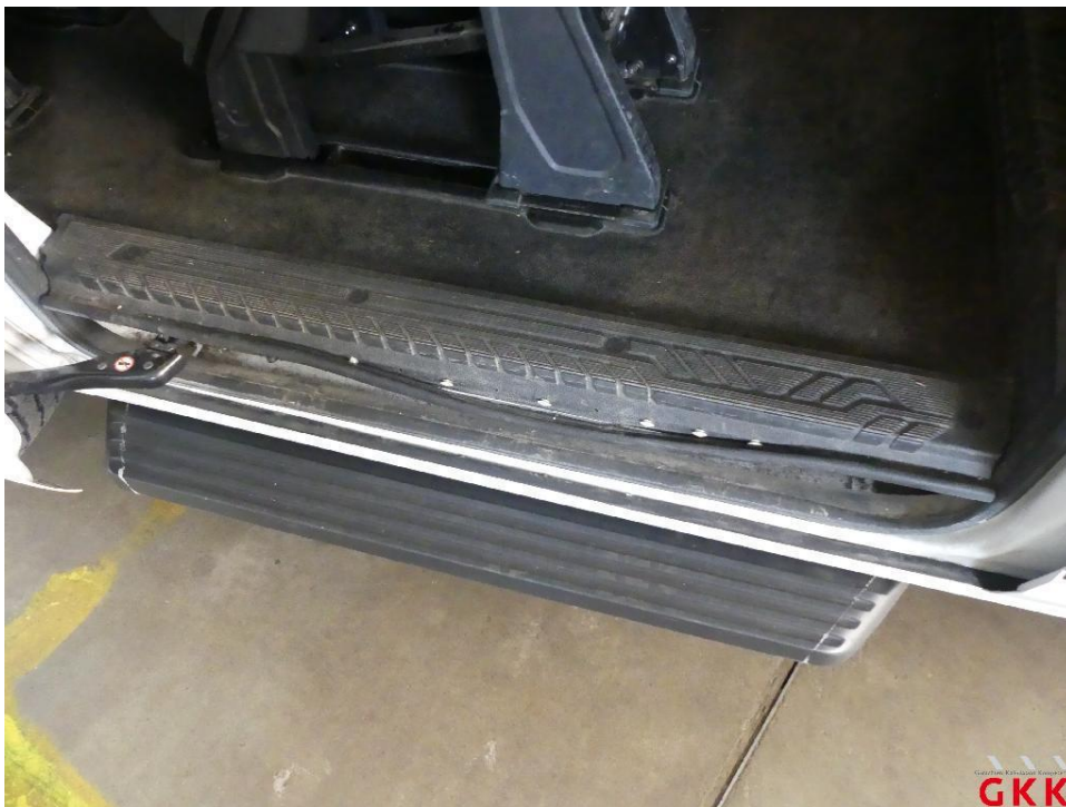
Bild 14 Schiebetür rechts, Dichtung -Einstieg-, lose, ersetzen