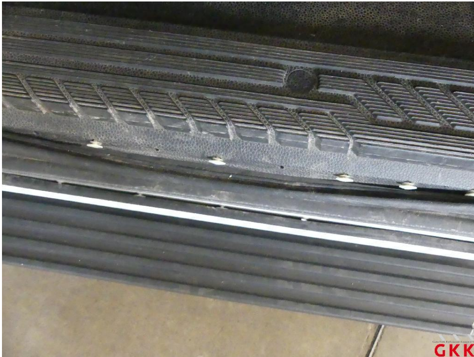
Bild 15 Schiebetür rechts, Dichtung -Einstieg-, lose, ersetzen