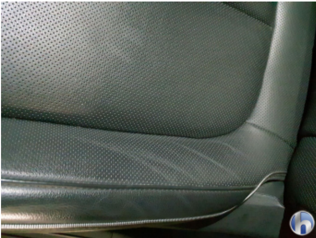
5. Sitz Innenraum links vorne Gebrauchsspuren - Ohne Reparatur