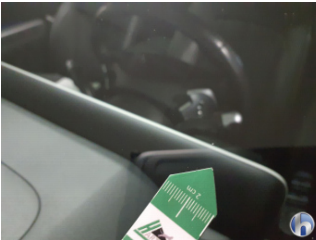
3. Windschutzscheibe Gebrauchsspuren - Ohne Reparatur