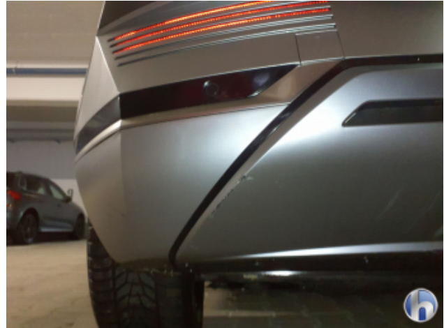
2. Stoßfänger Hinten Kratzer - Lackieren