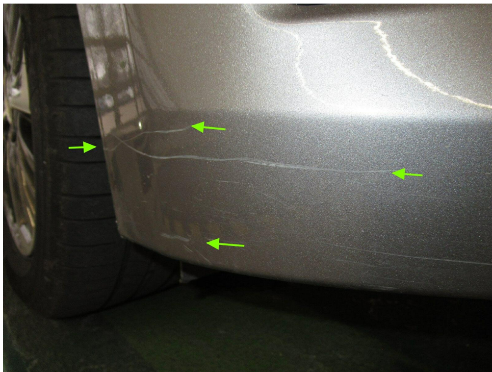
Bild 9 : Stoßfänger vorne Lackierung, zerkratzt, lackieren mit Lackaufbau