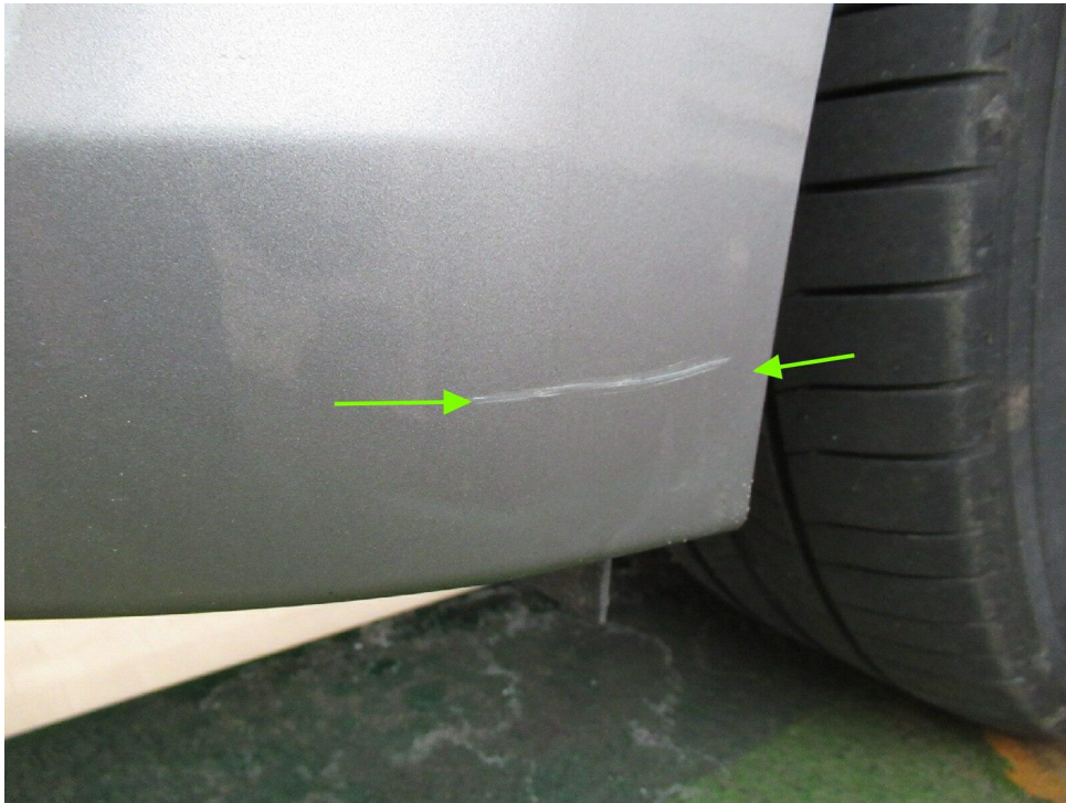
Bild 11 : Stoßfänger vorne Lackierung, zerkratzt, lackieren mit Lackaufbau