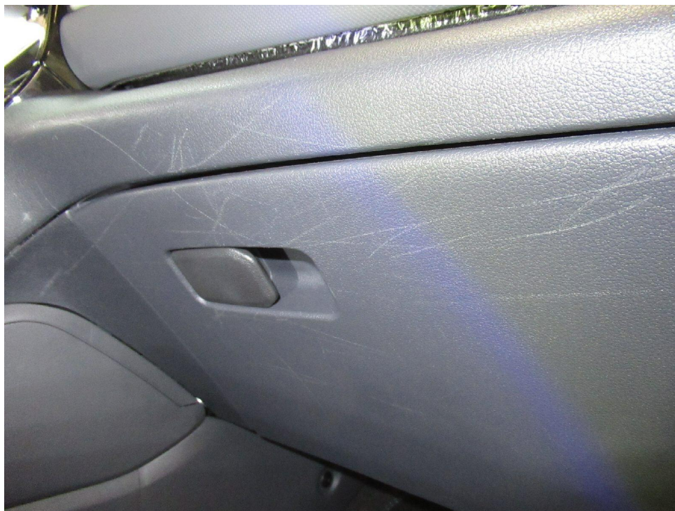
Bild 8 : Blenden und Handschuhfachdeckel des Armaturenbretts verschrammt