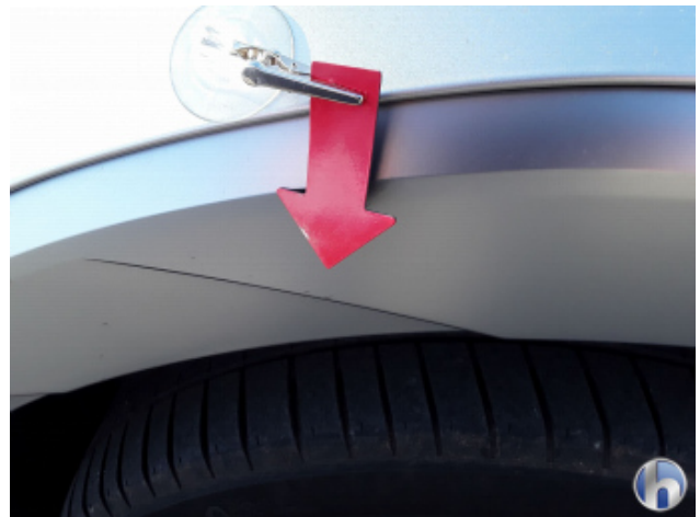
3. Radlaufverbreiterung re.vo. Kratzer - Lackieren