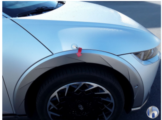
3. Radlaufverbreiterung re.vo. Kratzer - Lackieren