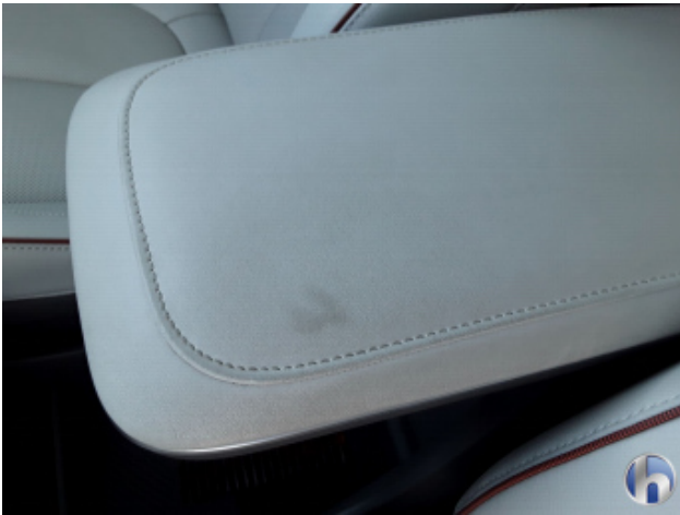
1. Mittelkonsole Innenraum vorne mitte Verschmutzt - Reinigen