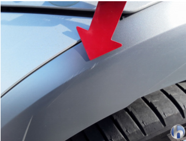
2. Radlaufverbreiterung li.vo. Kratzer - Lackieren