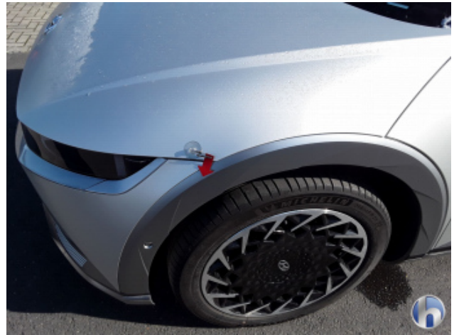
2. Radlaufverbreiterung li.vo. Kratzer - Lackieren