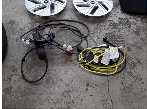
Illustration 20: Divers