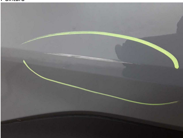
Dommage #3: Porte ArD: Porte - Erafilé - Peinture