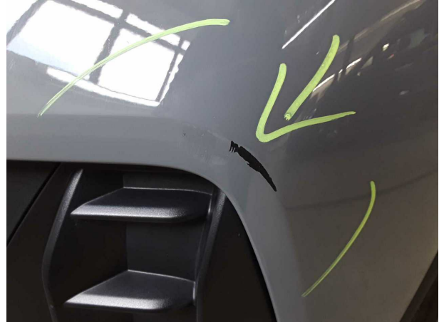
Beschädigung #2: Stossfänger vorn: Stossfänger vorn - verkratzt / verschürft - lackieren