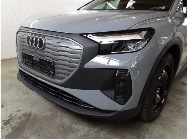
Beschädigung #2: Stossfänger vorn: Stossfänger vorn - verkratzt / verschürft - lackieren