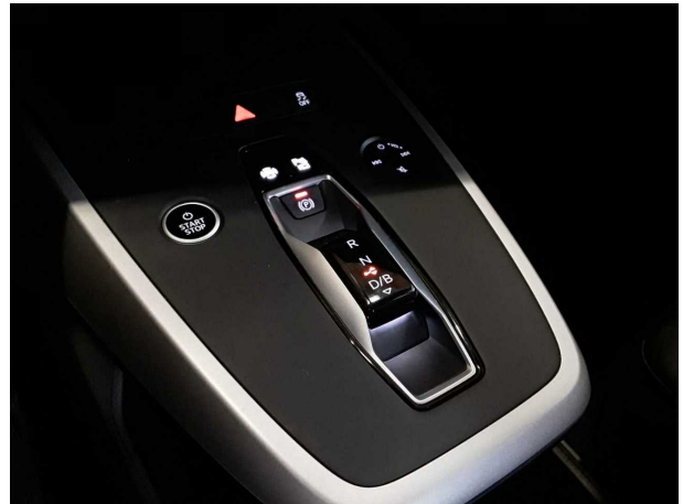
Abbildung 8: Innenraum