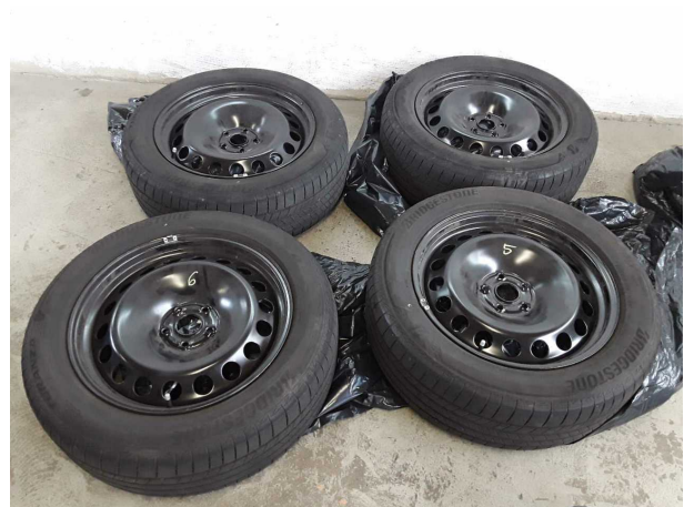
Abbildung 22: Sonstiges