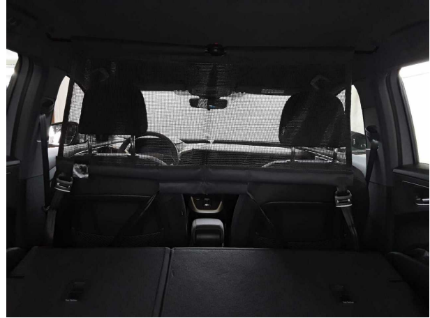
Abbildung 26: Sonstiges