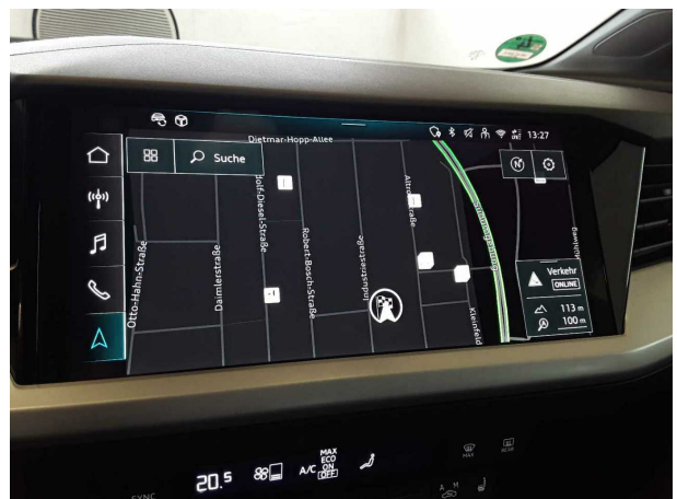
Abbildung 6: Innenraum