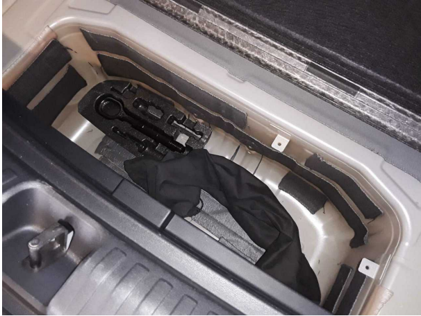
Abbildung 25: Sonstiges