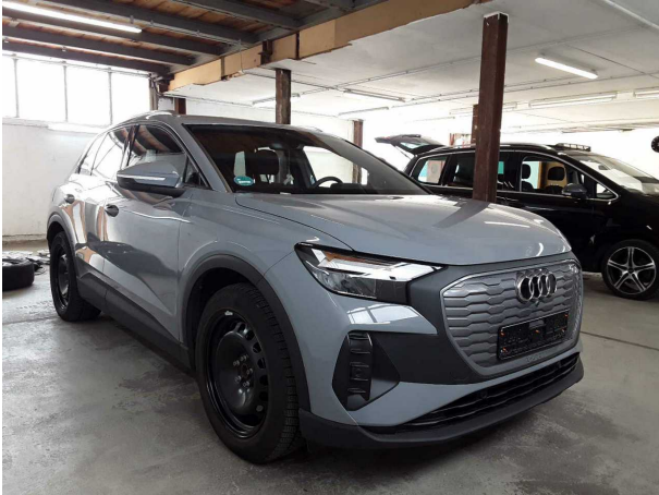
Abbildung 1: Schräg vorne