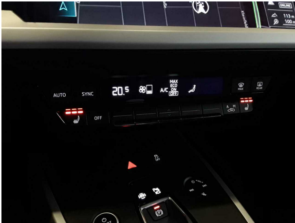
Abbildung 7: Innenraum