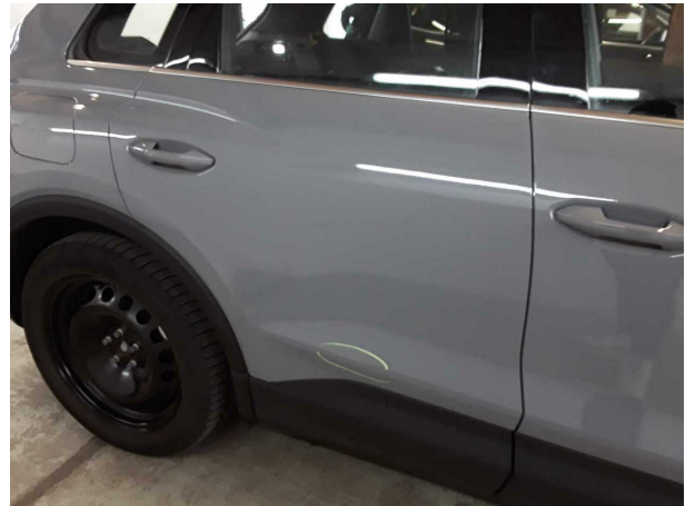
Beschädigung #3: Tür hinten rechts: Tür - verkratzt / versch... - lackieren