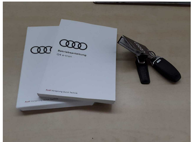
Abbildung 10: Sonstiges