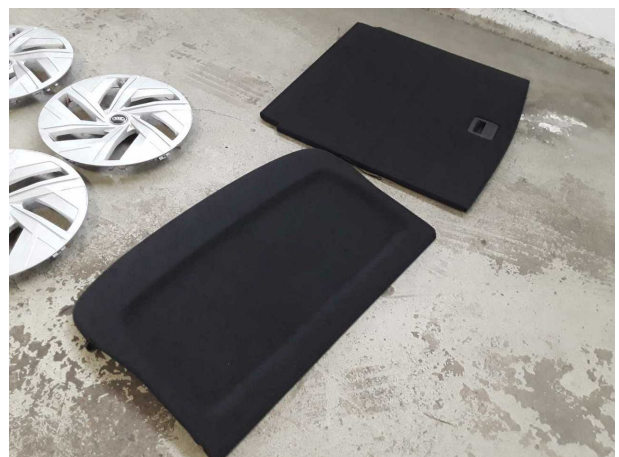
Abbildung 18: Sonstiges