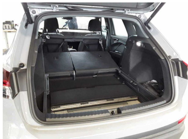
Abbildung 24: Sonstiges