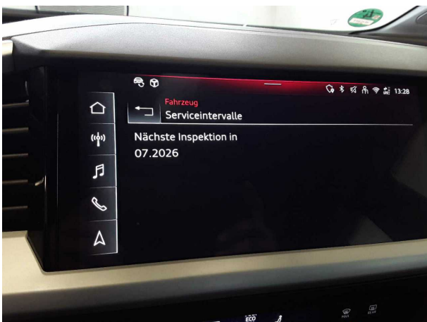
Abbildung 17: Sonstiges