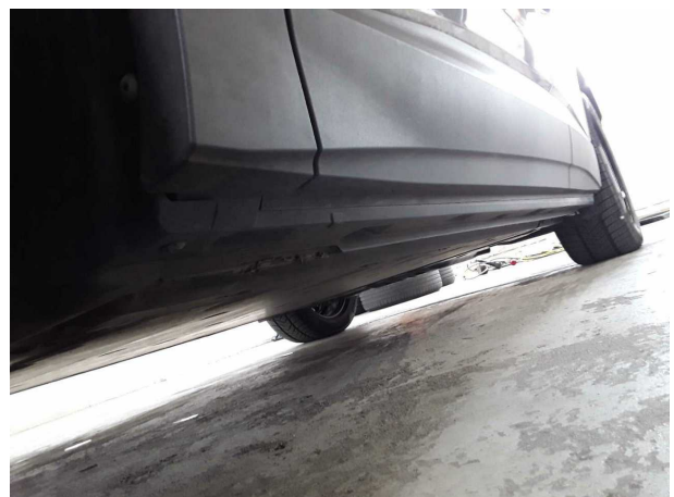
Abbildung 12: Sonstiges