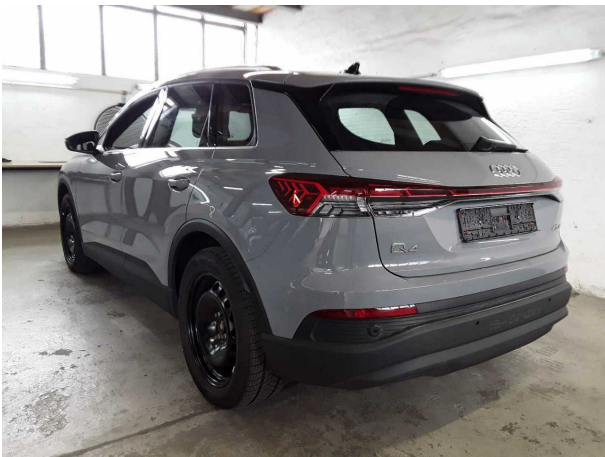
Abbildung 3: Schräg hinten