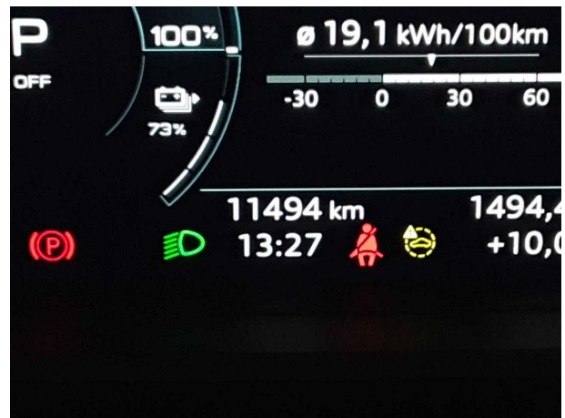
Abbildung 16: Sonstiges