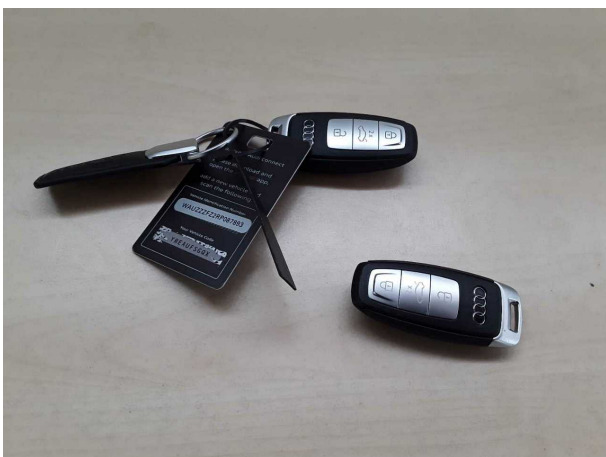
Abbildung 11: Sonstiges