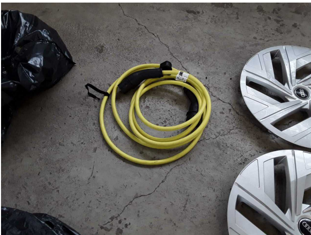
Abbildung 21: Sonstiges