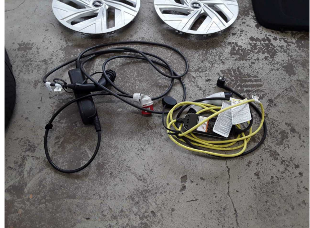
Abbildung 20: Sonstiges