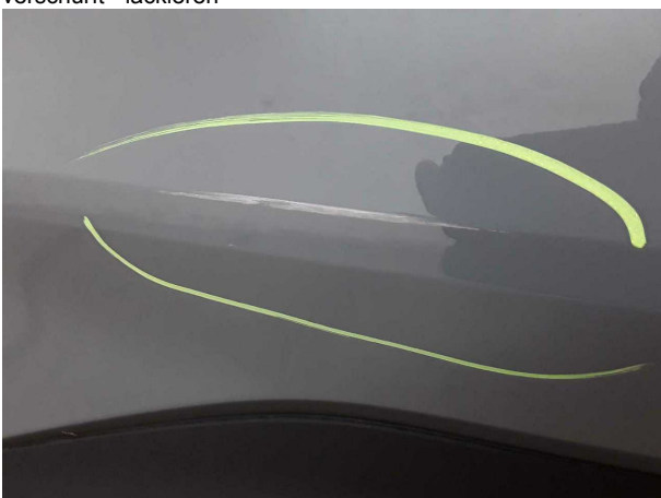
Beschädigung #3: Tür hinten rechts: Tür - verkratzt / verschürft - lackieren