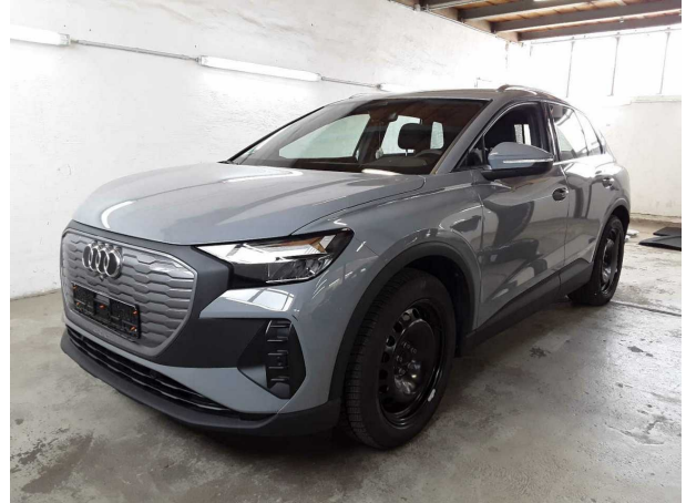
Abbildung 2: Schräg vorne