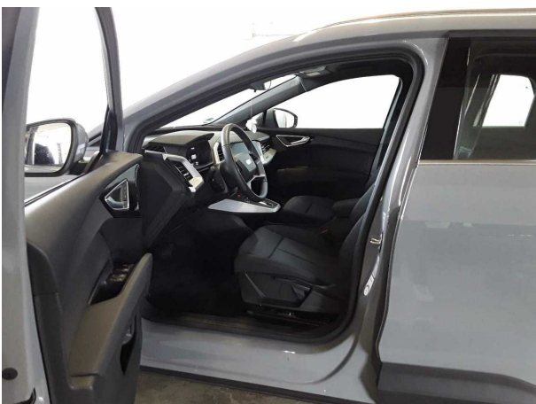
Abbildung 5: Innenraum