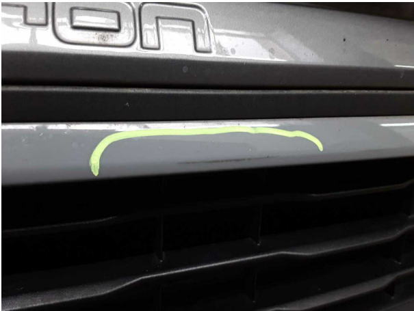
Beschädigung #2: Stossfänger vorn: Stossfänger vorn - verkratzt / verschürft - lackieren