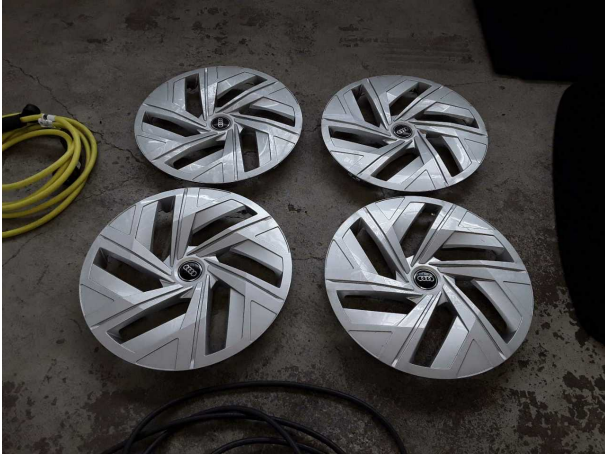
Abbildung 19: Sonstiges