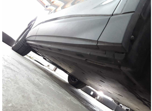
Abbildung 14: Sonstiges