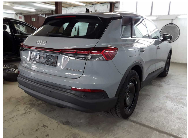
Abbildung 4: Schräg hinten