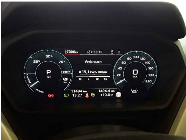
Abbildung 15: Sonstiges