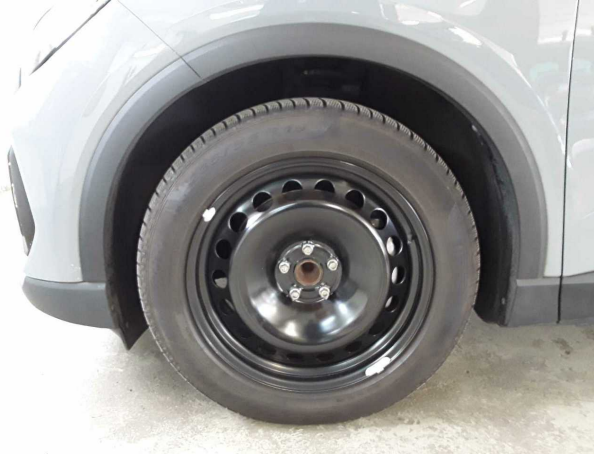
Abbildung 13: Sonstiges