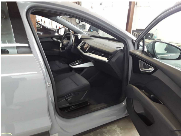
Abbildung 9: Innenraum