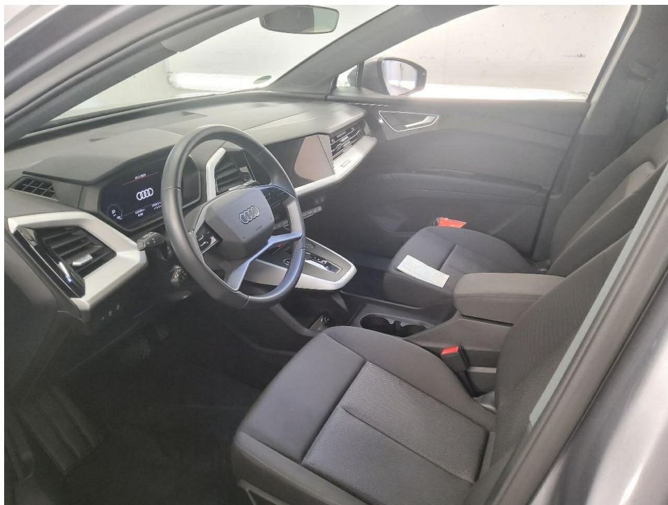
Bild 8 : Durch geöffnete Fahrertüre: Fahrersitz, Armaturenbrett und Schalthebel