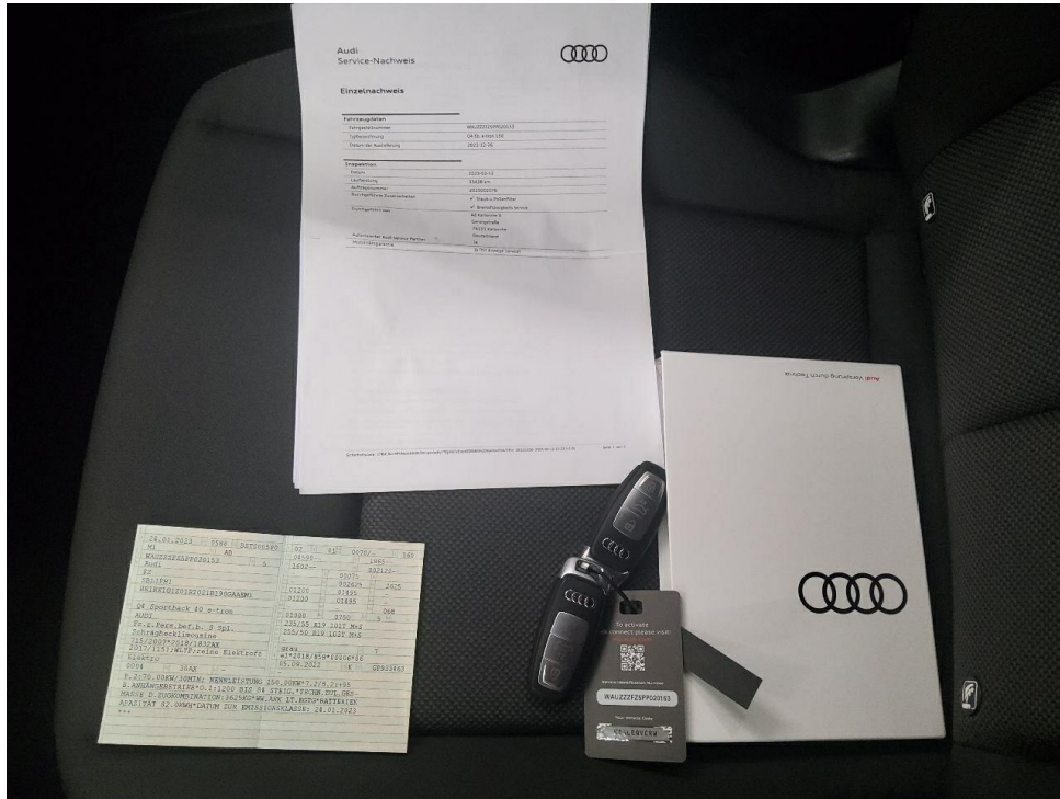
Bild 11 : Serviceheft letzter Eintrag, alle Fahrzeugschlüssel, Bordmappe