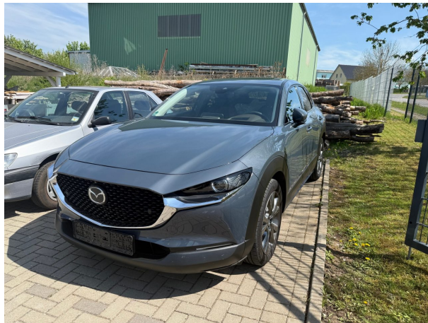
Abbildung 2: Schräg vorne