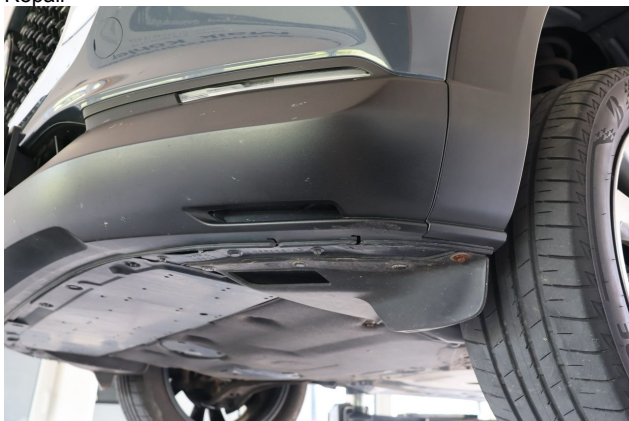
Beschädigung #3: Stossfänger vorn: Spoiler - verkratzt / verschürft - Wertminderung