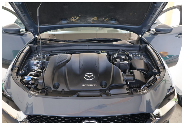
Abbildung 6: Motorraum