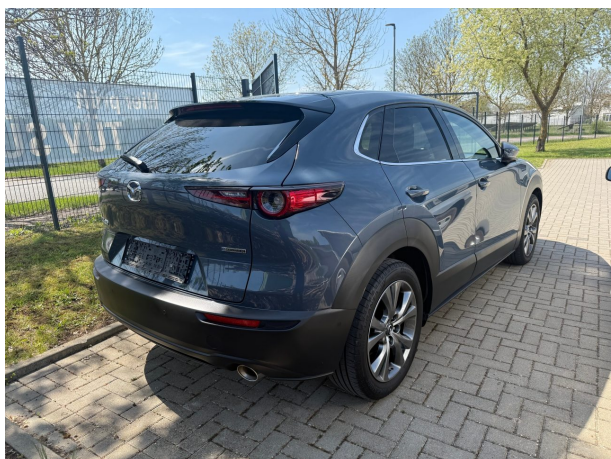
Abbildung 3: Schräg hinten