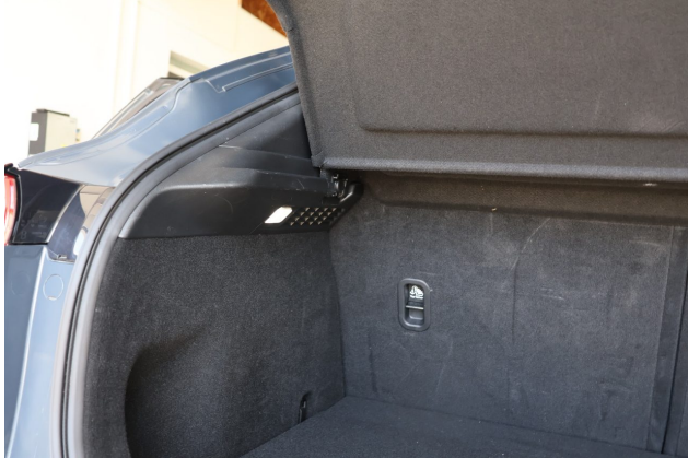
Beschädigung #1: Verkleidungen/Abdeckungen: Kofferraumverkleidung - verkratzt / verschürft - Wertminderung