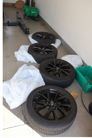
Abbildung 14: Sonstiges