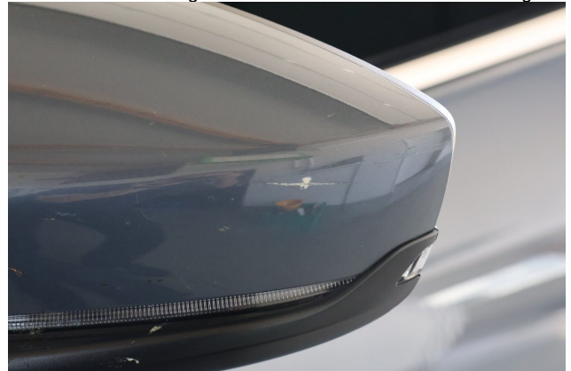
Beschädigung #2: Außenspiegel links: Abdeckkappe - Kratzer - Smart Repair