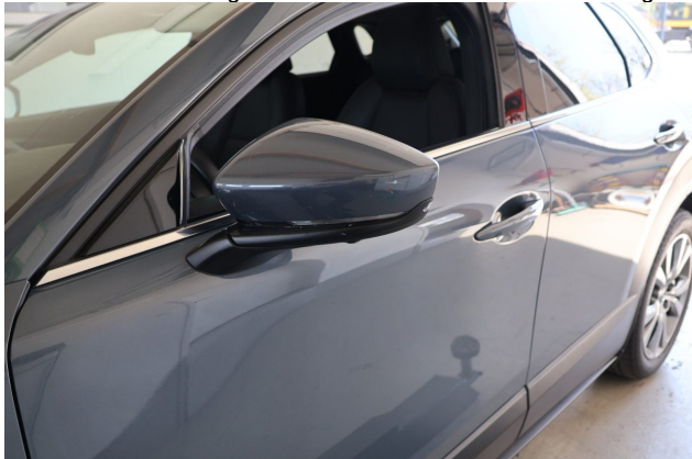
Beschädigung #2: Außenspiegel links: Abdeckkappe - Kratzer - Smart Repair