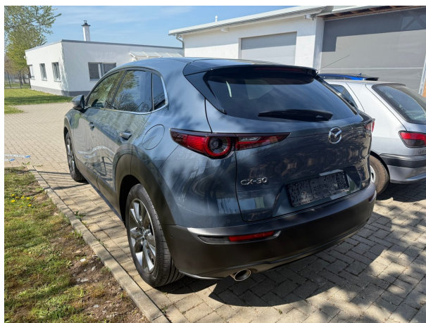
Abbildung 4: Schräg hinten