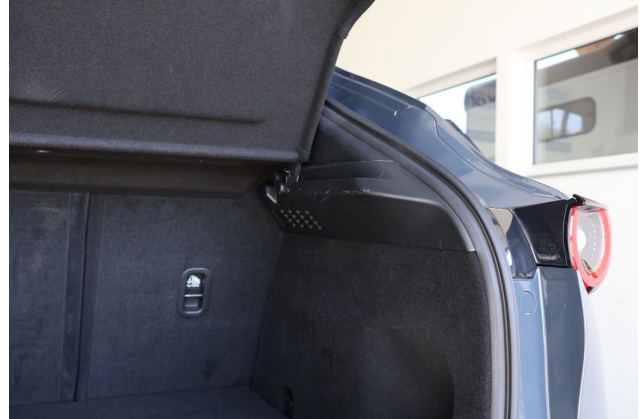
Beschädigung #1: Verkleidungen/Abdeckungen: Kofferraumverkleidung - verkratzt / verschürft - Wertminderung