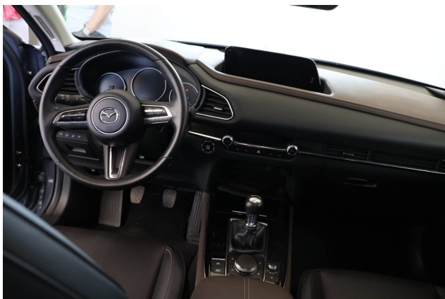
Abbildung 11: Instrumententafel