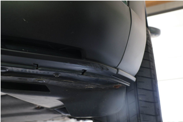
Beschädigung #3: Stossfänger vorn: Spoiler - verkratzt / verschürft - Wertminderung