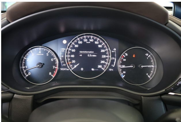
Abbildung 9: Kombiinstrument