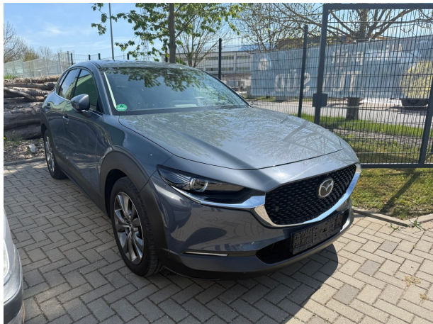
Abbildung 1: Schräg vorne