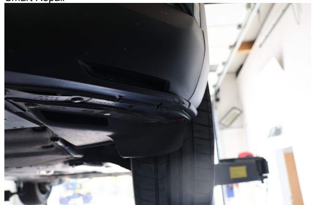
Beschädigung #3: Stossfänger vorn: Spoiler - verkratzt / versch... - Wertminderung