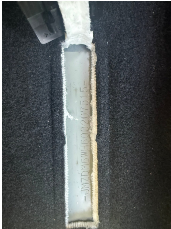
Abbildung 7: FIN