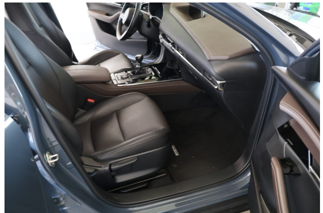
Abbildung 8: Innenraum vorne