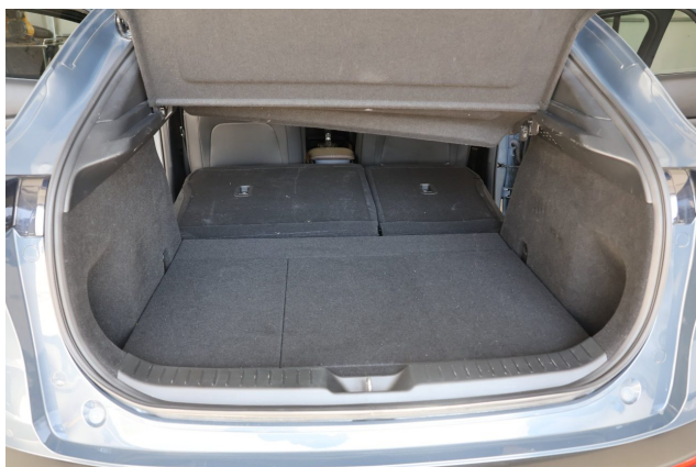
Abbildung 5: Laderaum