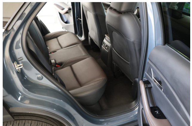
Abbildung 12: Innenraum hinten