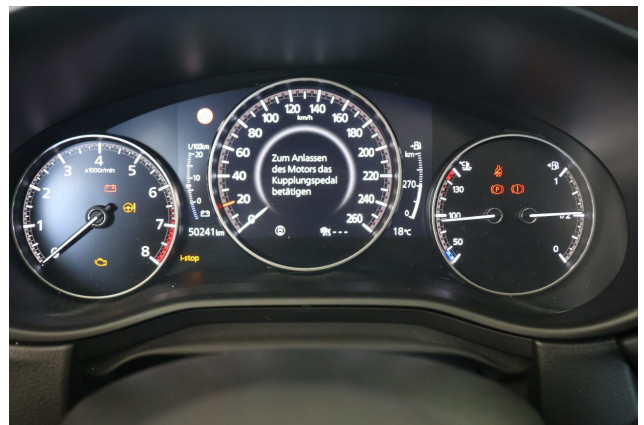
Abbildung 10: Laufleistung